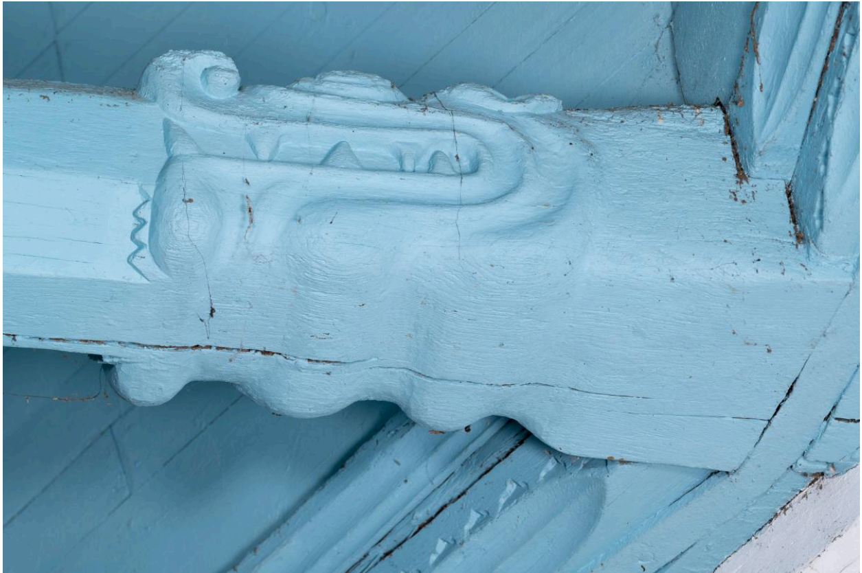
Engoulant dévorant un entrait de la charpente du chœur.