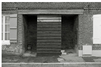
Le puits de la cité, en 1990, vue de face. IVR22_19908000031Z