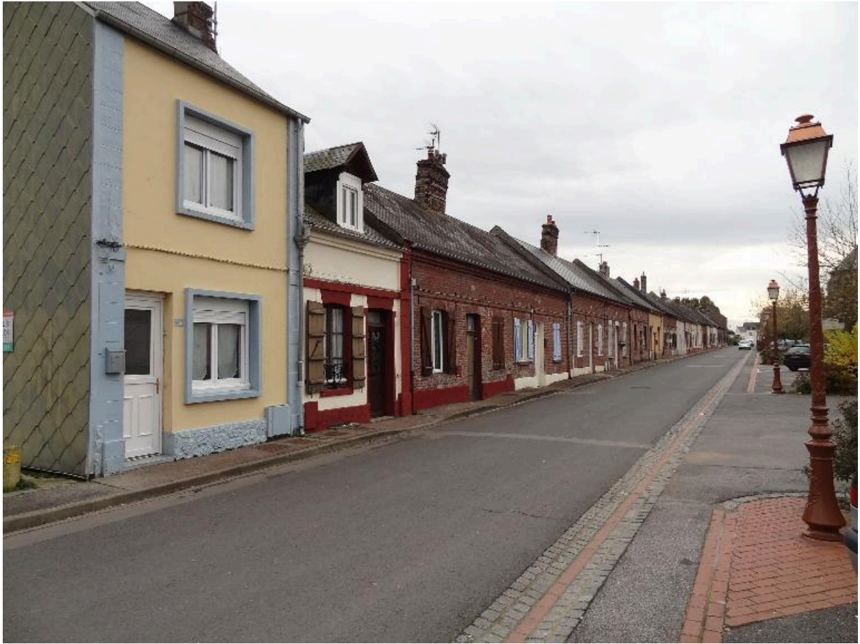
Vue générale, depuis le nord.