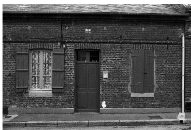
Façade d'un des logements, en 1990.