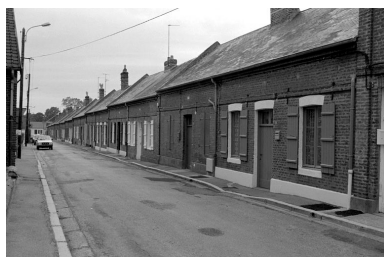
La cité Guerville en 1990.