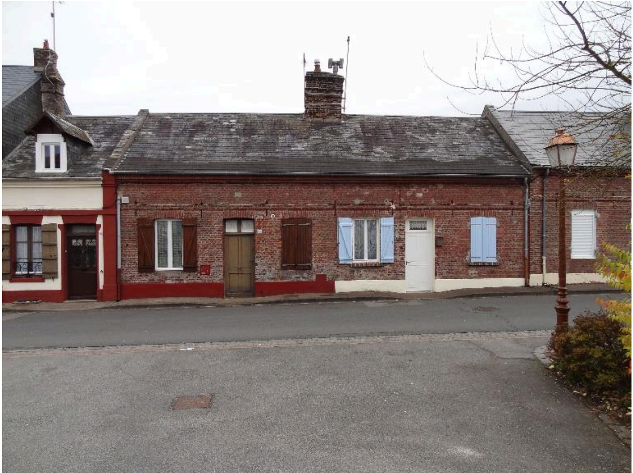
Vue d'une des maisons à deux unités d'habitation.