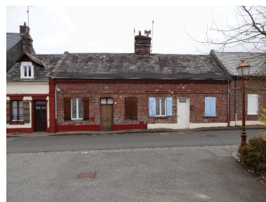
Vue d'une des maisons à deux unités d'habitation. IVR22_20128005215NUC1A