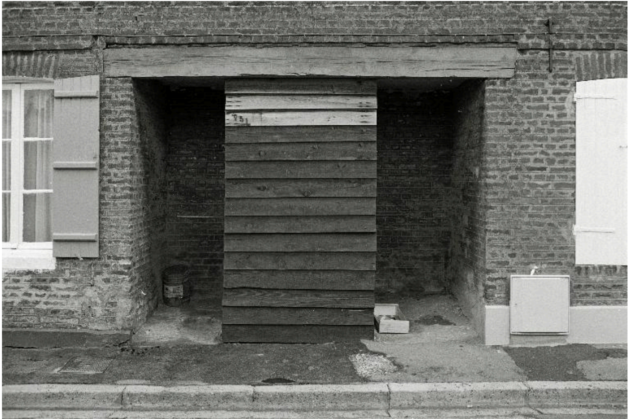
Le puits de la cité, en 1990, vue de face.