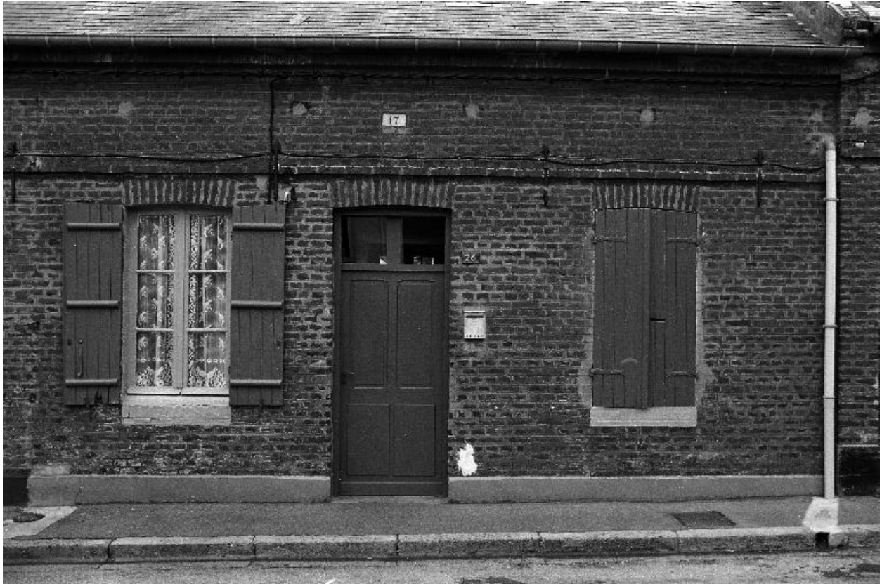
Façade d'un des logements, en 1990.