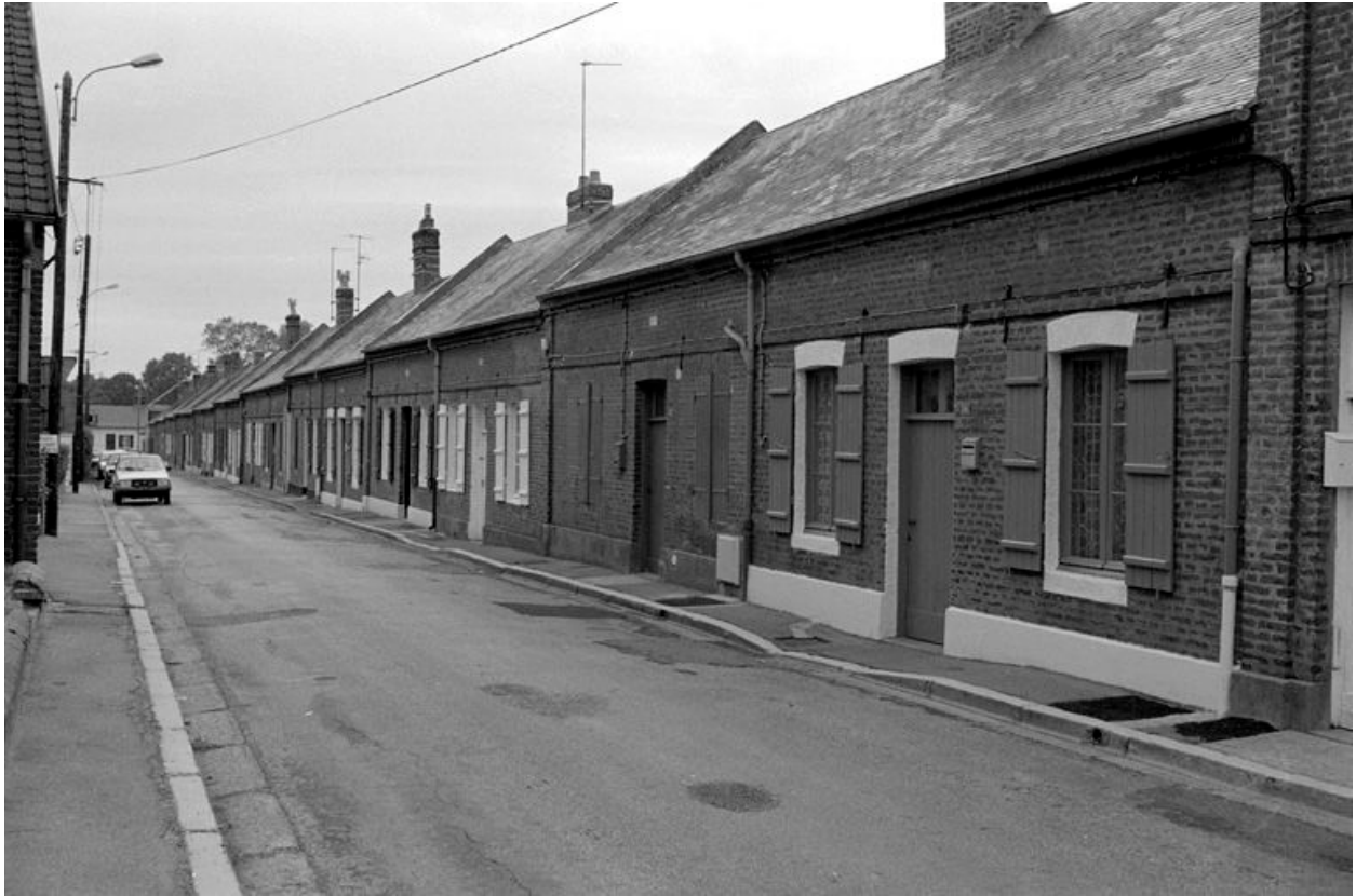
La cité Guerville en 1990.