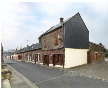
Vue générale depuis le sud. IVR22_20138000029NUC2A