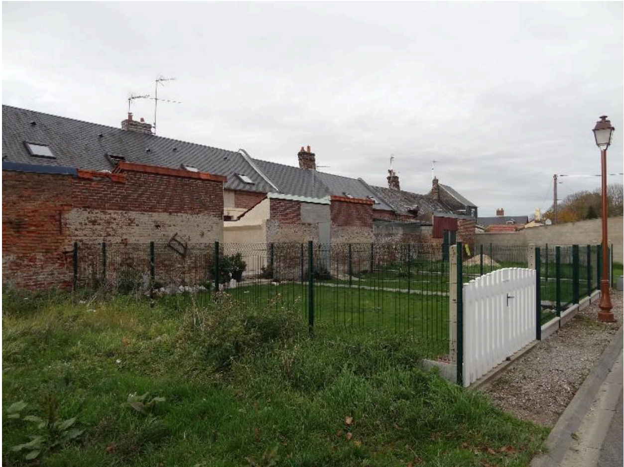
Vue des façades arrières des ateliers et des logements.