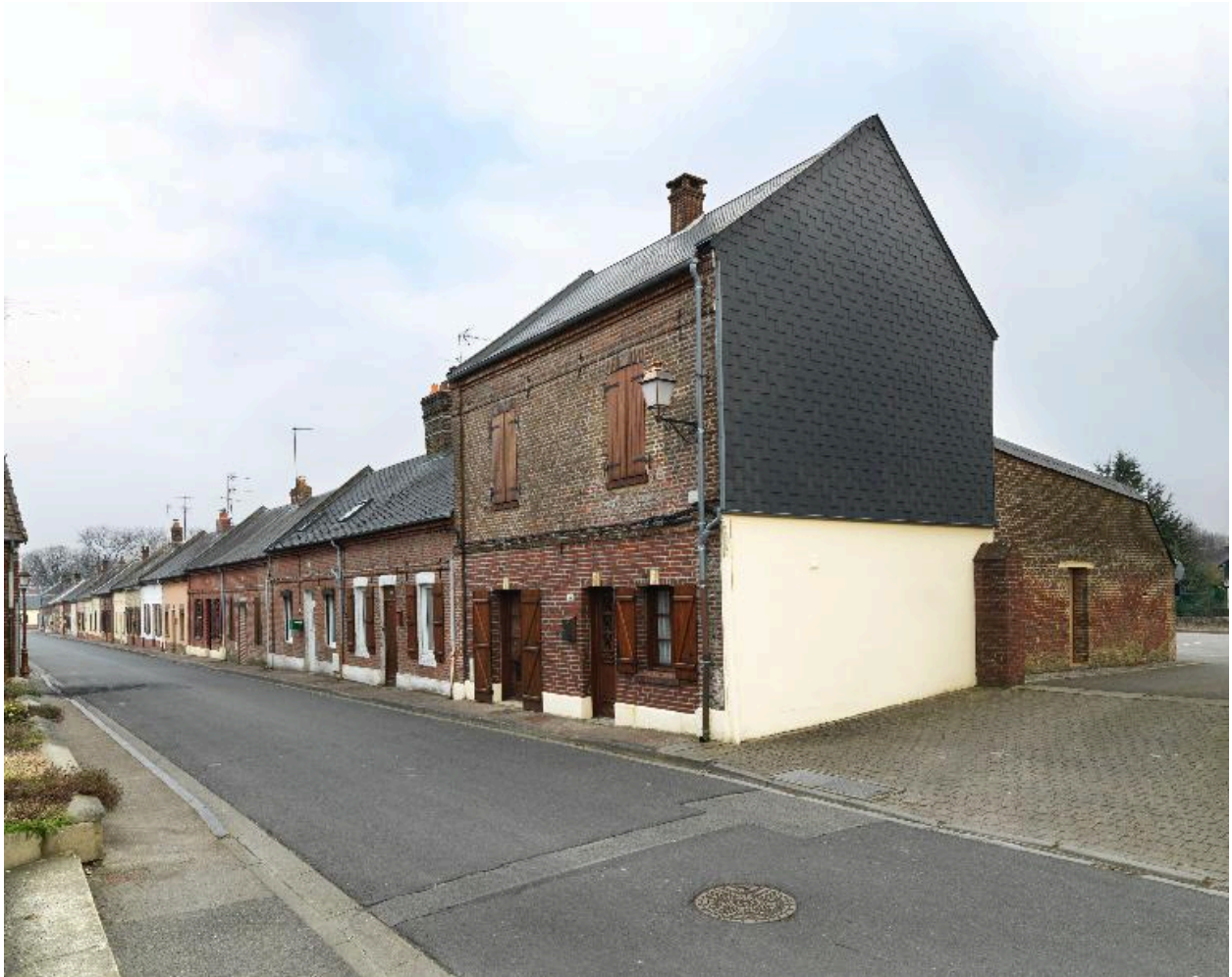
Vue générale depuis le sud.