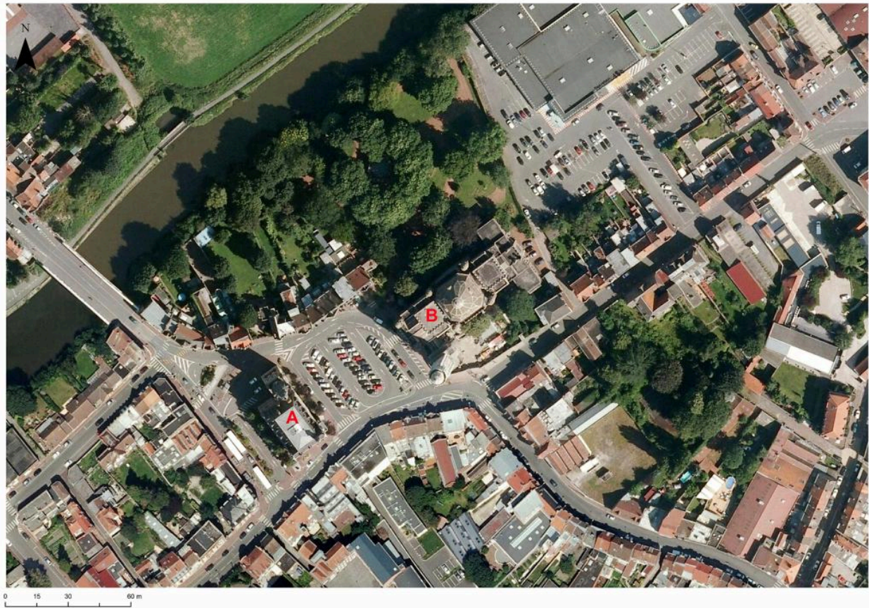
Photographie aérienne de 2018 présentant l'hôtel de ville (en A) et l'église Saint-Chrysole (en B).