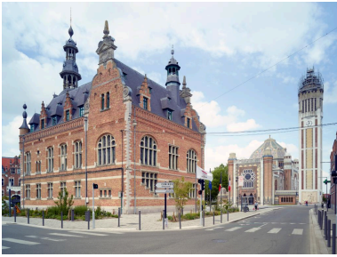
Vue d'ensemble depuis ouest. IVR32_20215900096NUCA

IVR32_20215905023NUCA