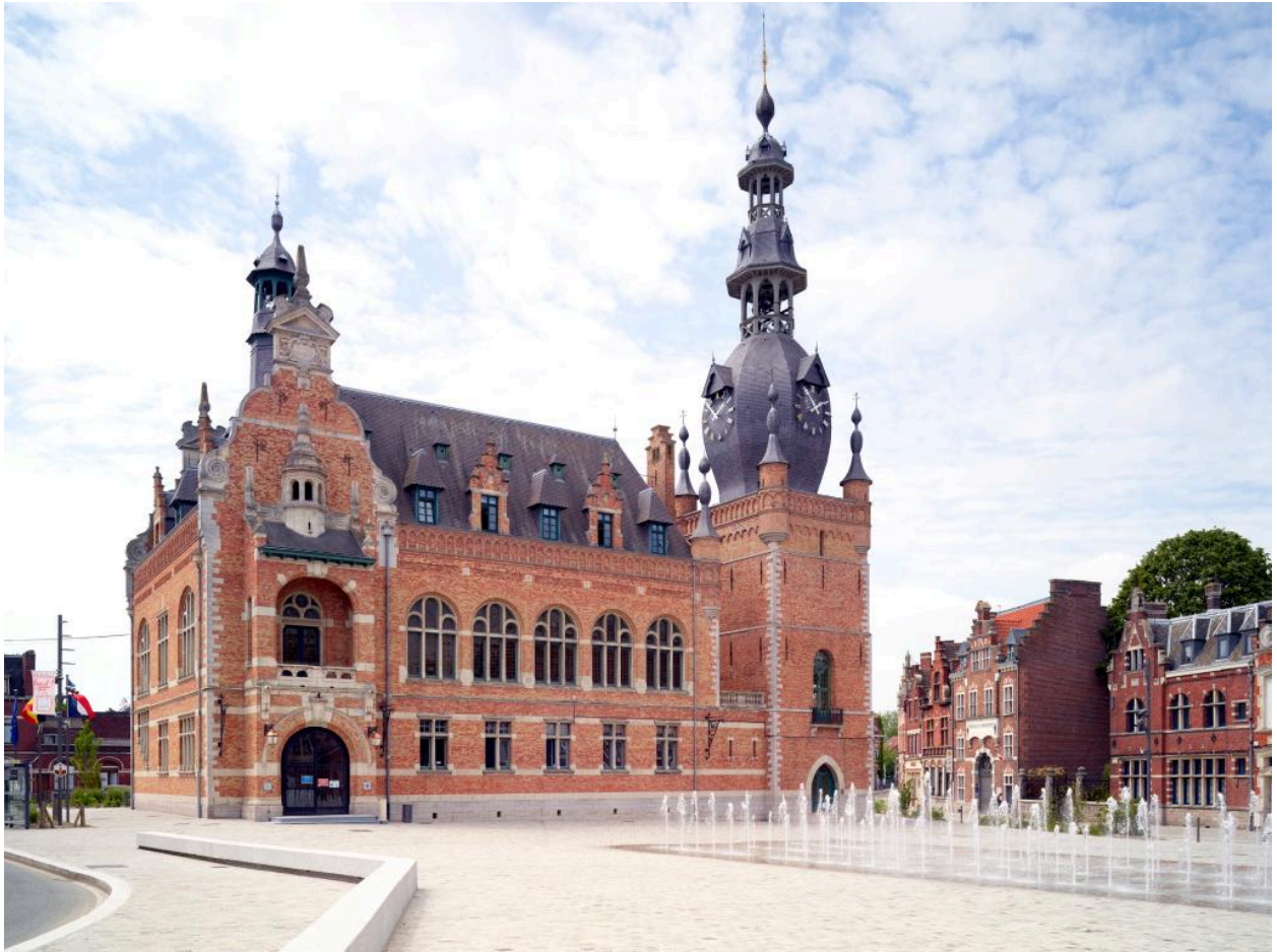
Vue générale depuis la Grand'Place, à l'est.