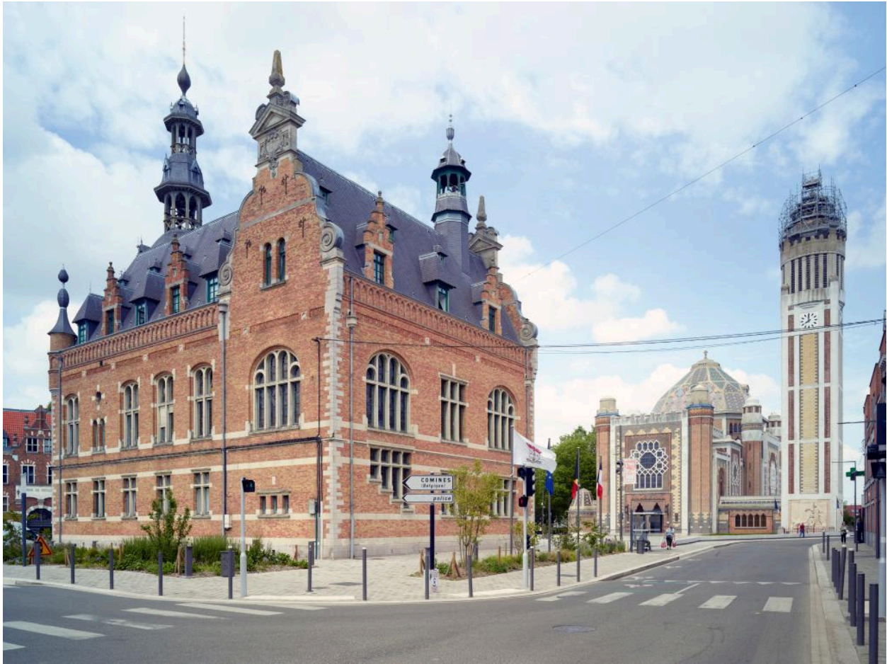
Vue d'ensemble depuis ouest.