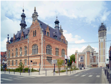
Vue d'ensemble depuis ouest.