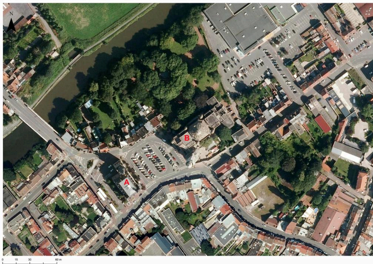
Photographie aérienne de 2018 présentant l'hôtel de ville (en A) et l'église Saint-Chrysole (en B).