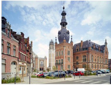
Vue d'ensemble depuis le nord. IVR32_20215900097NUCA