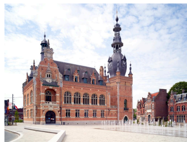
Vue générale depuis la Grand'Place, à l'est.