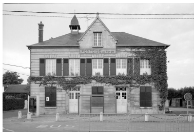
Vue générale. IVR22_19846001144X