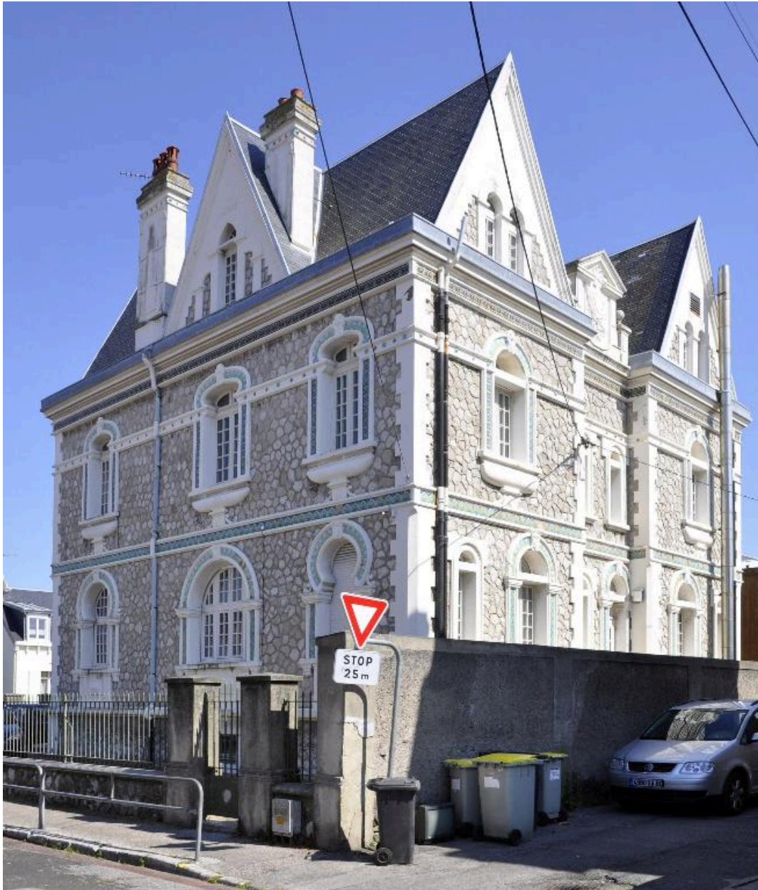
Vue générale prise de trois-quarts droit.