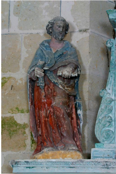
Vue de la statue de saint Pierre. IVR22_20040202721NUC1A