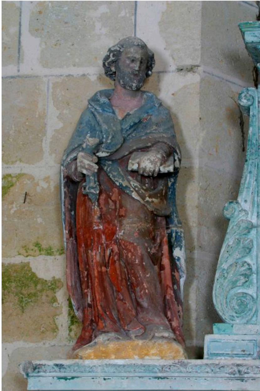
Vue de la statue de saint Pierre.