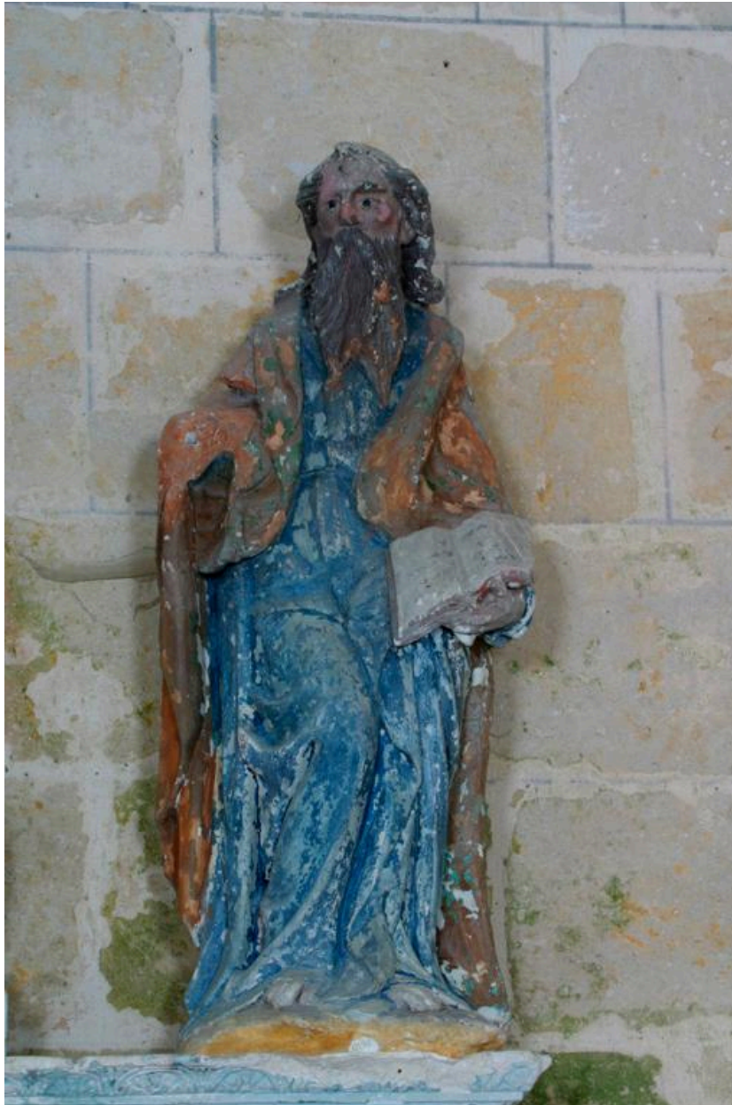
Vue de la statue de saint Paul.