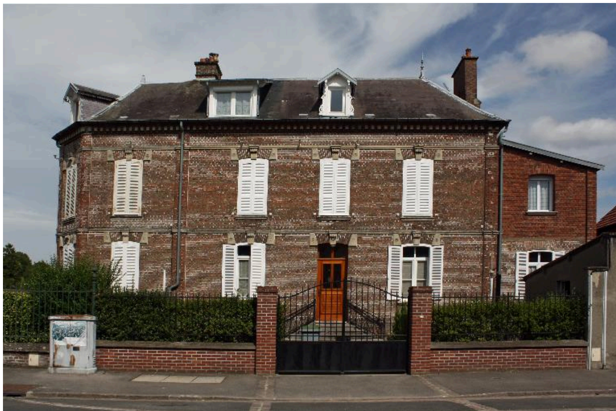
Façade donnant sur la rue de la République.