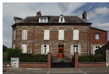
Façade donnant sur la rue de la République. IVR22_20138016184NUCA