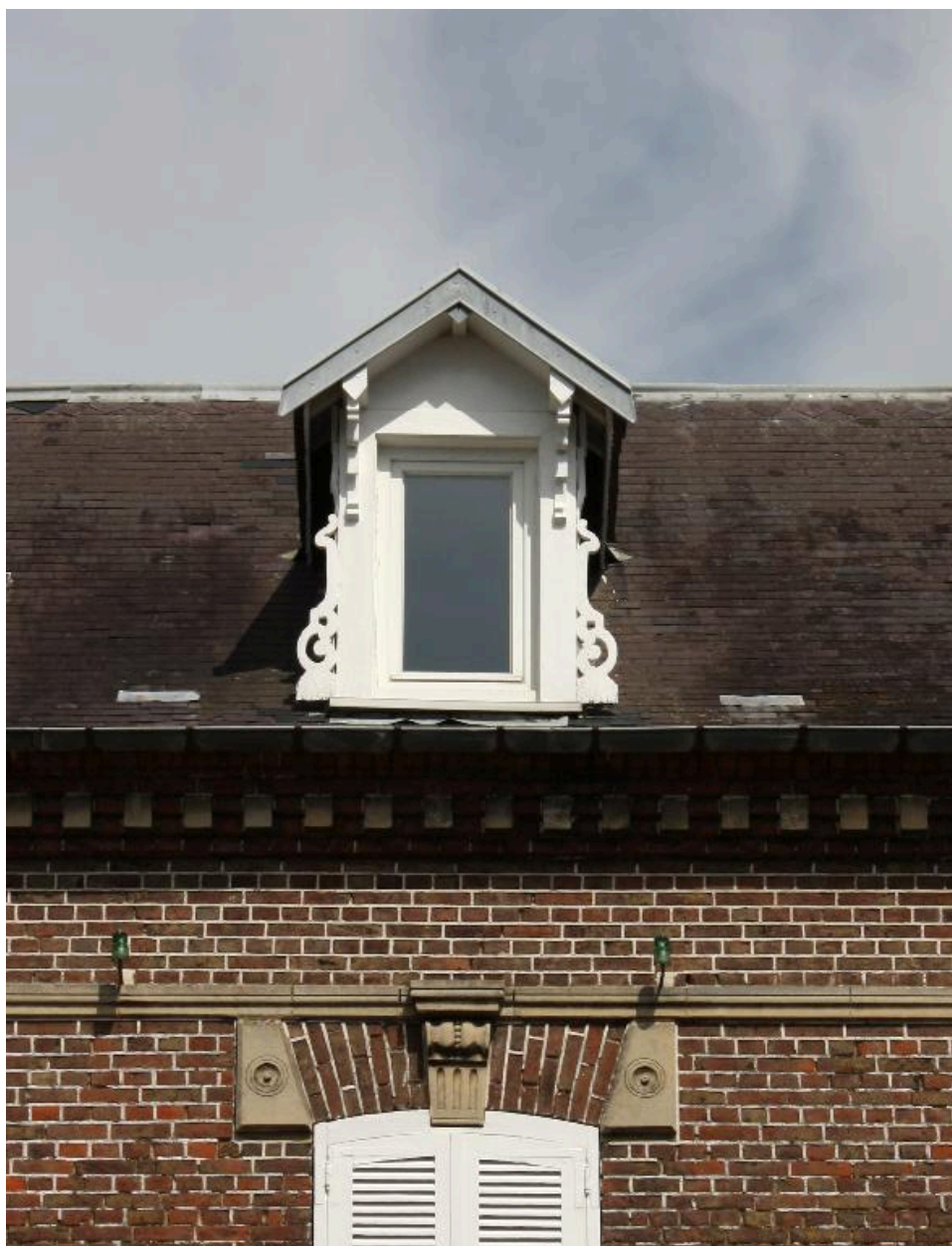
Détail de la lucarne de toit.