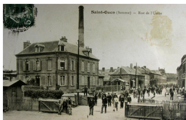
Sortie du personnel de l'usine de Saint-Ouen, vers 1905 (coll. part.).