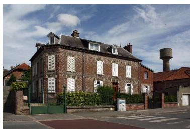
Vue d'ensemble. IVR22_20138016185NUCA