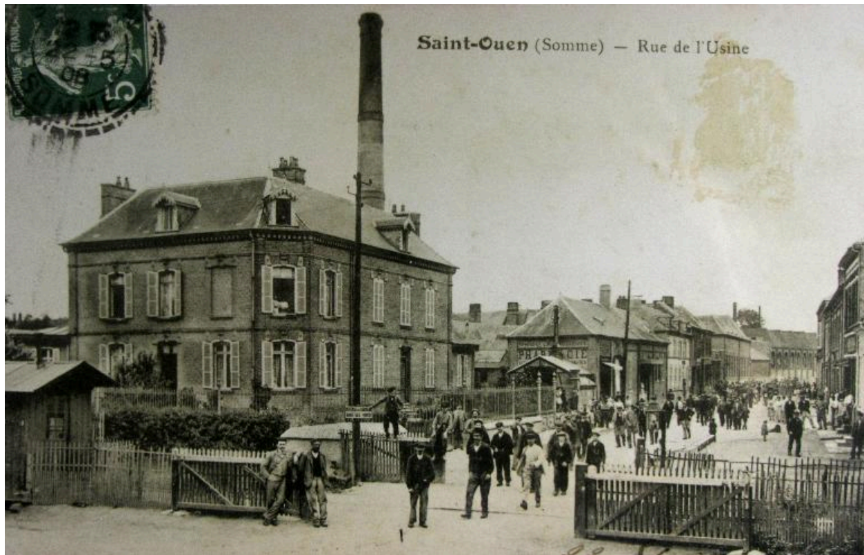
Sortie du personnel de l'usine de Saint-Ouen, vers 1905.