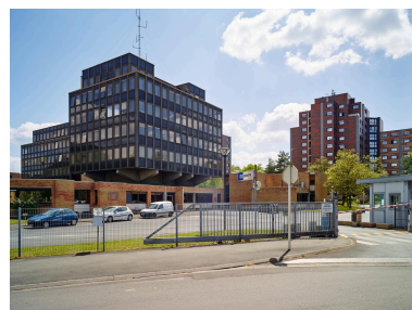
Vue d'ensemble depuis l'entrée, boulevard de Mons.