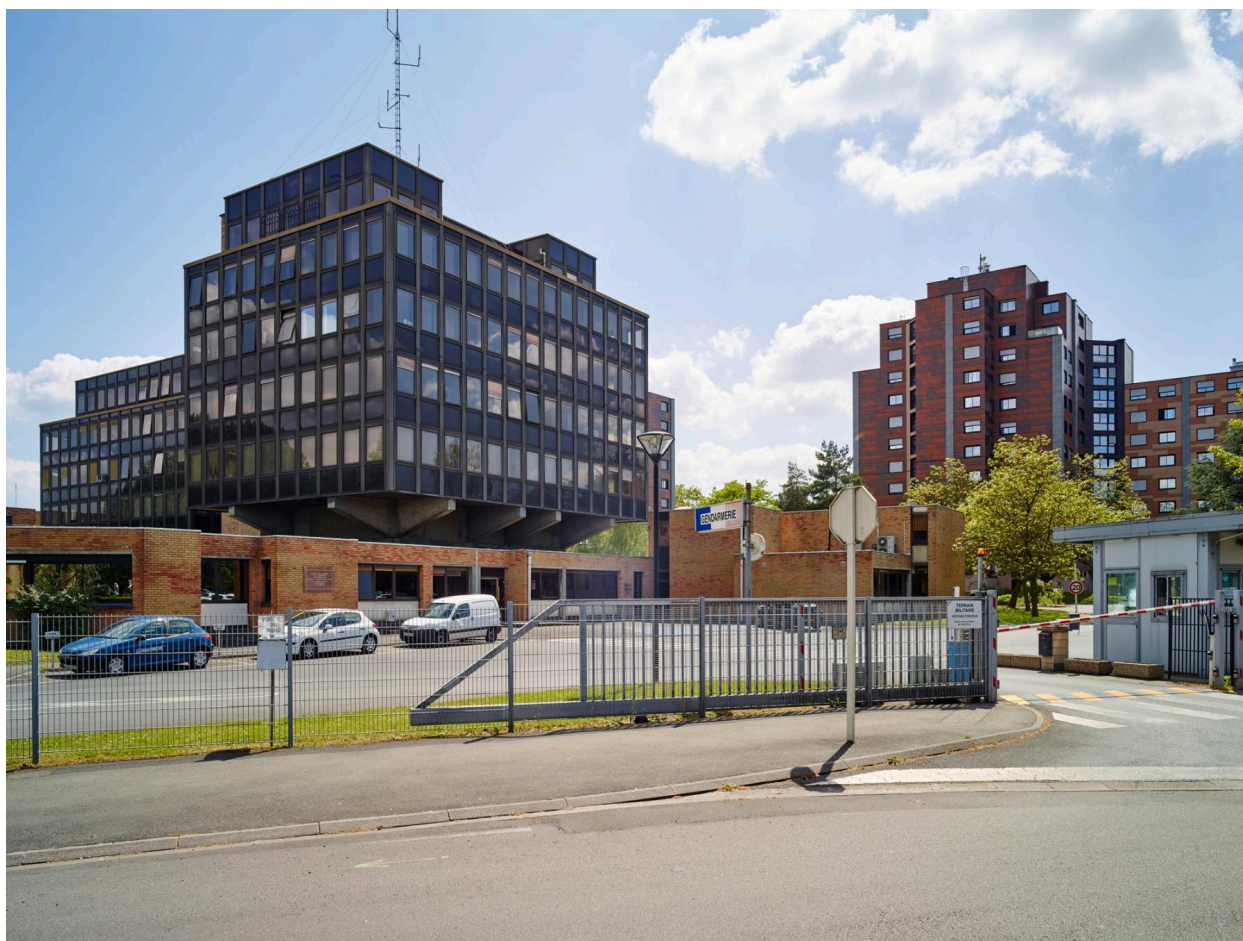
Vue d'ensemble depuis l'entrée, boulevard de Mons.