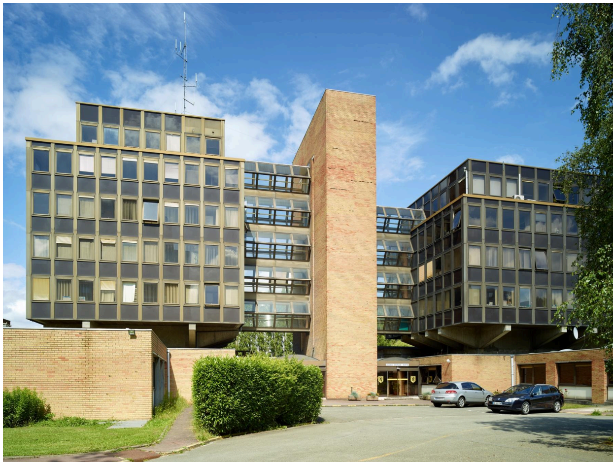
La façade nord du bâtiment administratif.