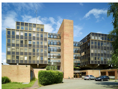
La façade nord du bâtiment administratif.