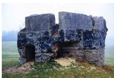
Vue d'un des derniers blockhaus présent sur le territoire d'Aizy.