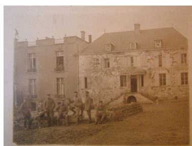
Vue du château de Volvreux pendant l'occupation allemande (coll. part). IVR22_20050200452NUCAB