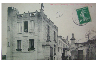
Vue du château de Volvreux avant sa destruction.