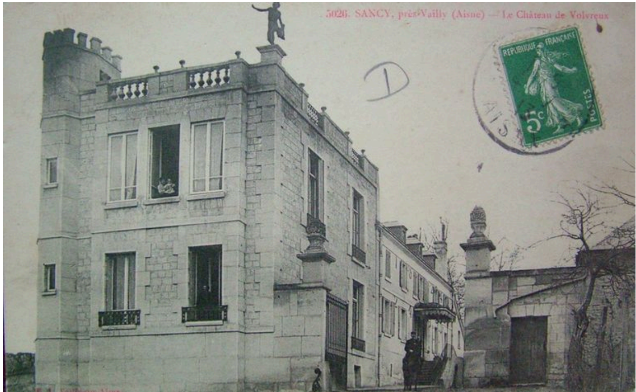
Vue du château de Volvieux avant sa destruction (coll. part).