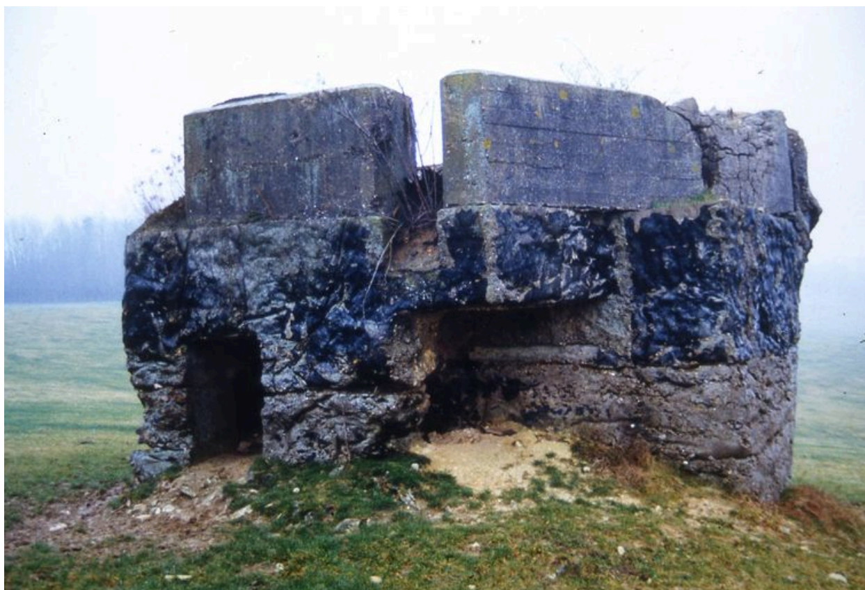
Vue d'un des derniers blockhaus présent sur le territoire d'Aizy.