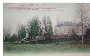
Vue du château de Vauxcelles avant sa destruction (coll. part).