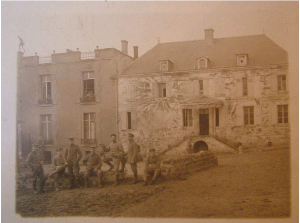
Vue du château de Volvieux pendant l'occupation allemande (coll. part).