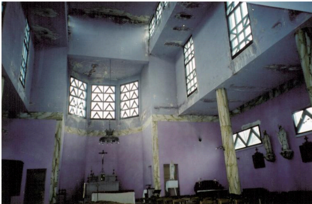
Vue intérieure de l'église.