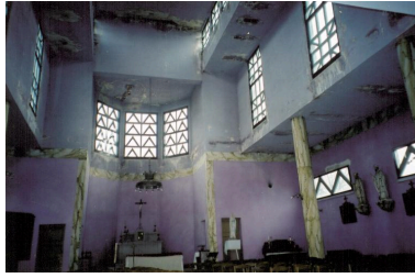
Vue intérieure de l'église. IVR22_20158005491NUCA

IVR22_20158005492NUCA