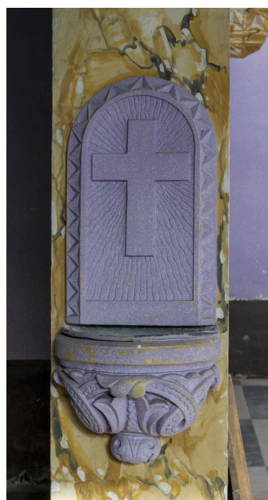
Vue d'un des deux bénitiers.