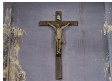
Vue du Christ en croix, au dessus de la tribune.