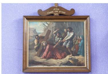
Vue d'une station du chemin de croix.