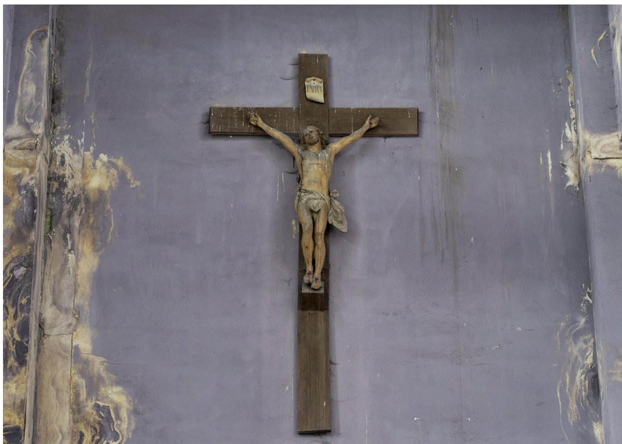
Vue du Christ en croix, au dessus de la tribune.