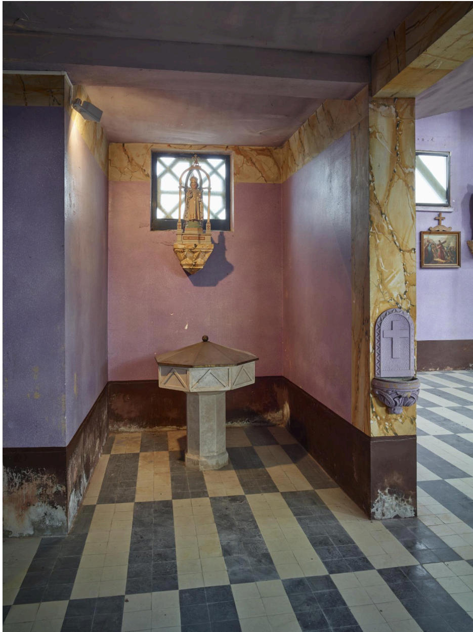
Vue des fonts baptismaux.