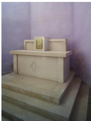
Vue du maître-autel.