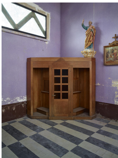
Vue du confessionnal.