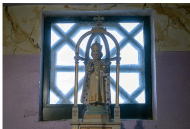
Statue Enfant Jésus de Prague. IVR32_20258002302NUCA