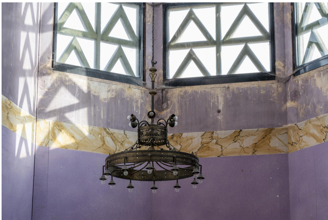
Vue du luminaire du chœur.