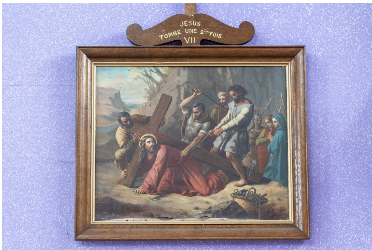
Vue d'une station du chemin de croix.