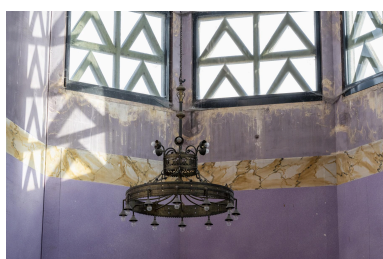
Vue du luminaire du chœur. IVR32_20258002305NUCA