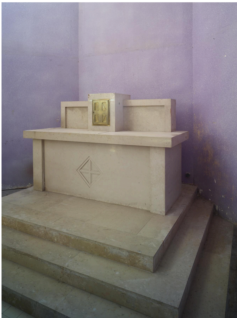
Vue du maître-autel.