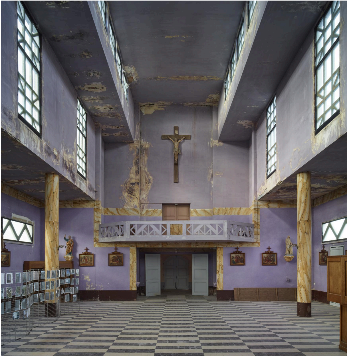
Vue générale depuis le chœur.