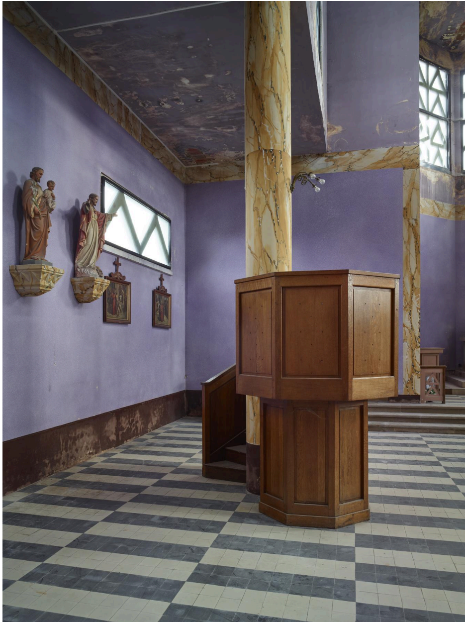
Vue de la chaire à prêcher.