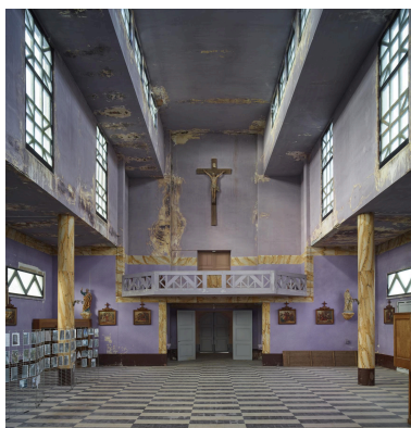
Vue générale depuis le chœur.