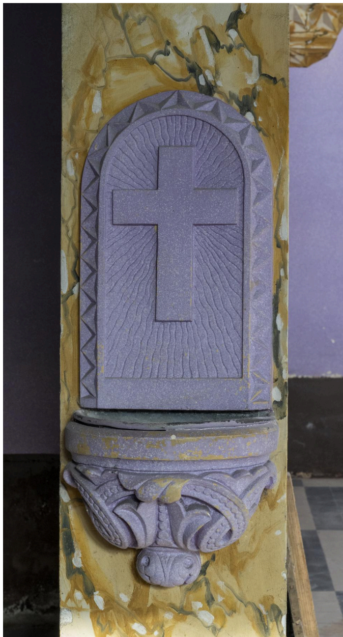
Vue d'un des deux bénitiers.