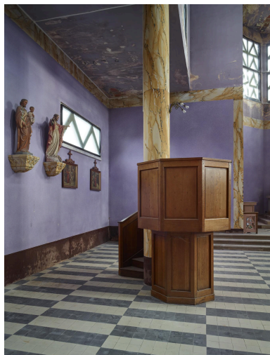
Vue de la chaire à prêcher.