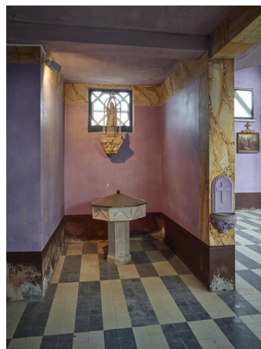
Vue des fonts baptismaux.