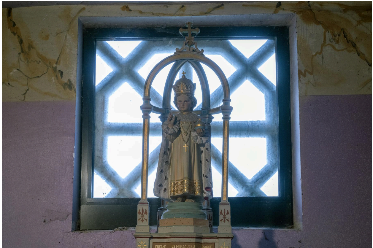
Statue Enfant Jésus de Prague.