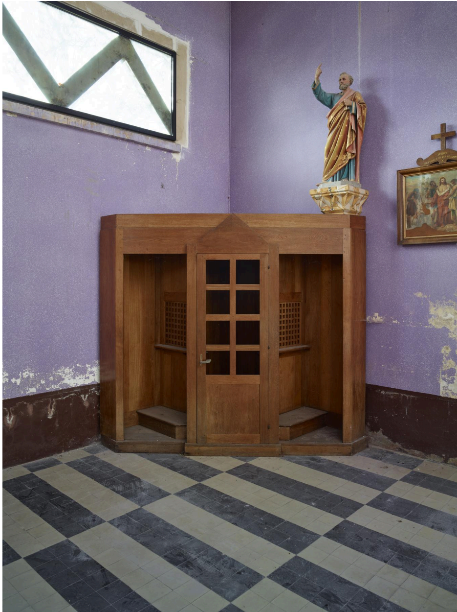
Vue du confessionnal.