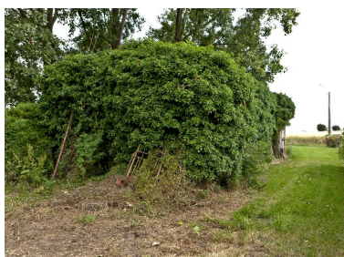
Vue vers le nord-est IVR31_20145905230NUCA