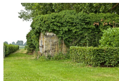
Vue vers le sud-ouest IVR31_20145905229NUCA