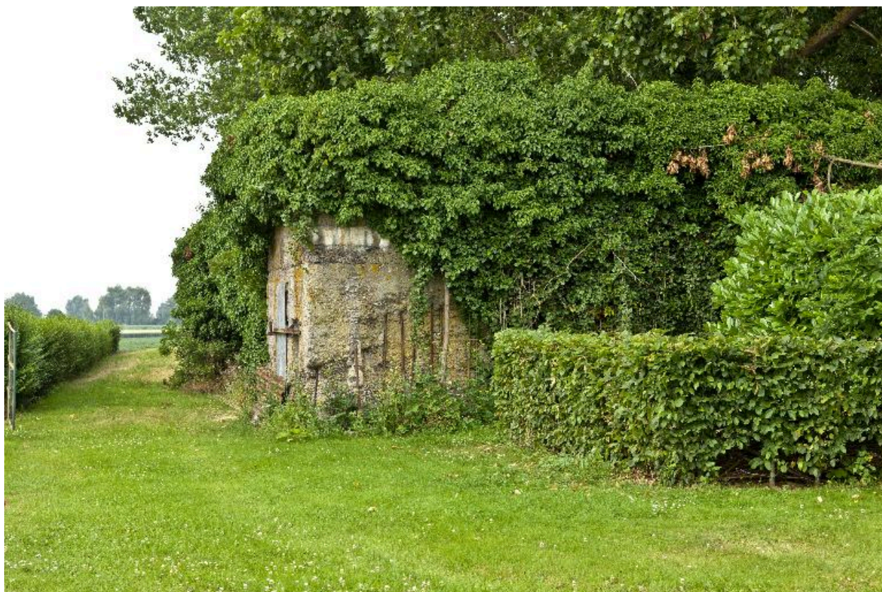
Vue vers le sud-ouest