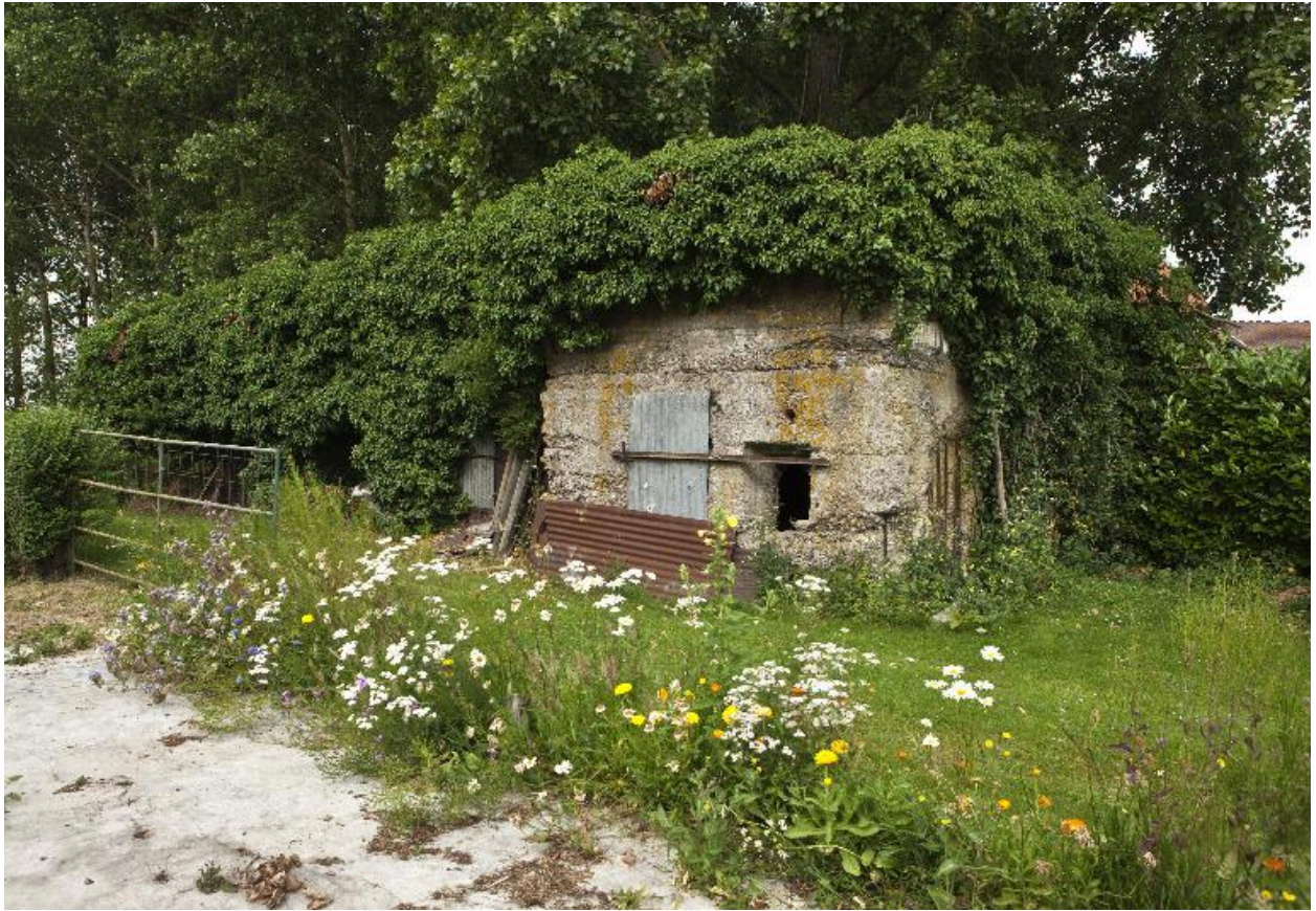
Entrée et fenêtre sur l'élévation sud-est