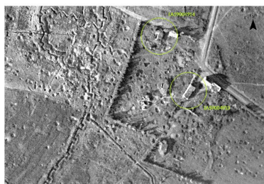
Plan de situation de l'édifice (cercle du bas) sur une photographie aérienne britannique du 12/09/1918 IVR32_20175900741NUCA

Carte du réseau ferroviaire allemand, daté du 23/02/1917. L'édifice se trouve très exactement au point nommé VI/d. IVR32_20175900445NUCA