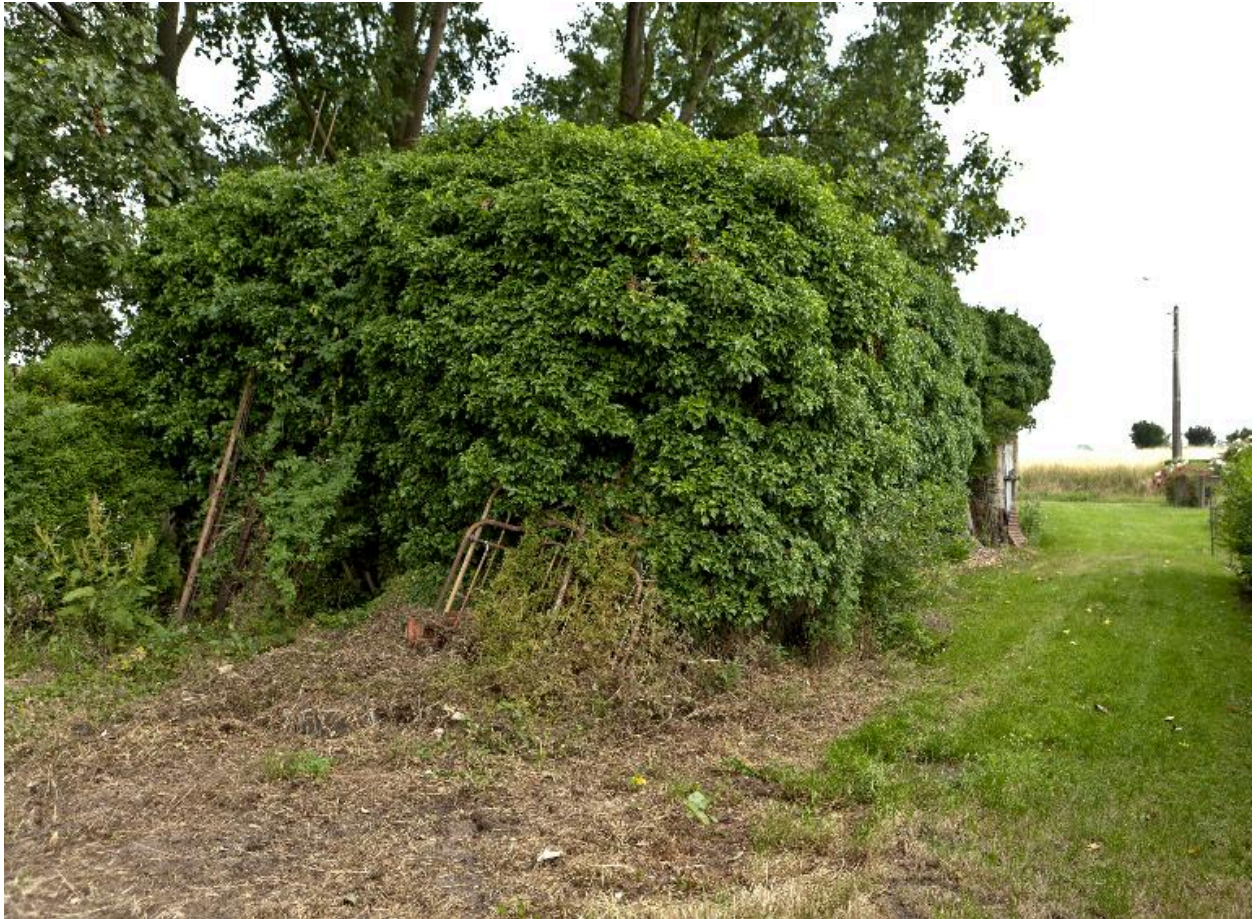
Vue vers vers le nord-est