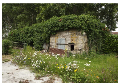
Entrée et fenêtre sur l'élévation sud-est IVR31_20145905231NUCA