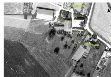
Plan de situation de l'édifice (cercle du bas) sur une photographie aérienne de 1981. IVR32_20175900742NUCA