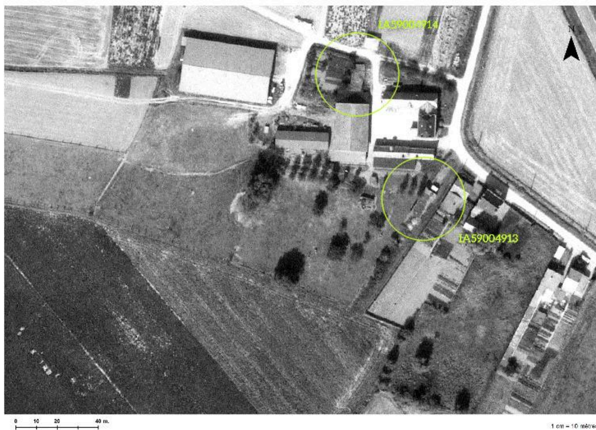
Plan de situation de l'édifice (cercle du bas) sur une photographie aérienne de 1981.