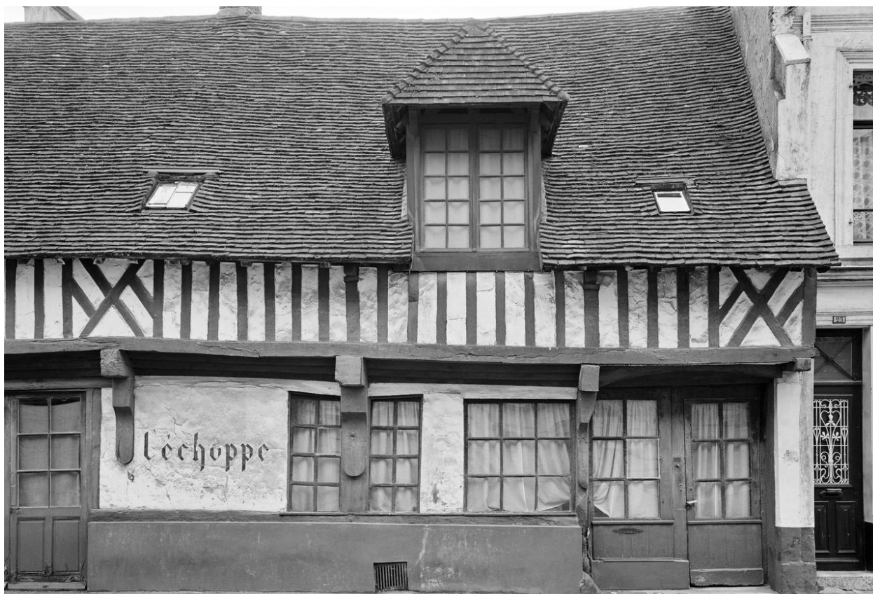
Le Petit-Écu. Façade sur rue (1981).