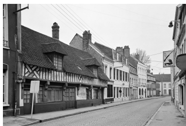
L'Âne rayé et Le Petit-Écu. Vue générale (1981).