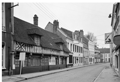
L'Âne rayé et Le Petit-Écu. Vue générale (1981).