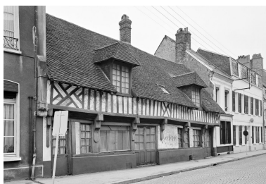
L'Âne rayé et Le Petit-Écu. Façade sur rue (1981). IVR31_19816201115X