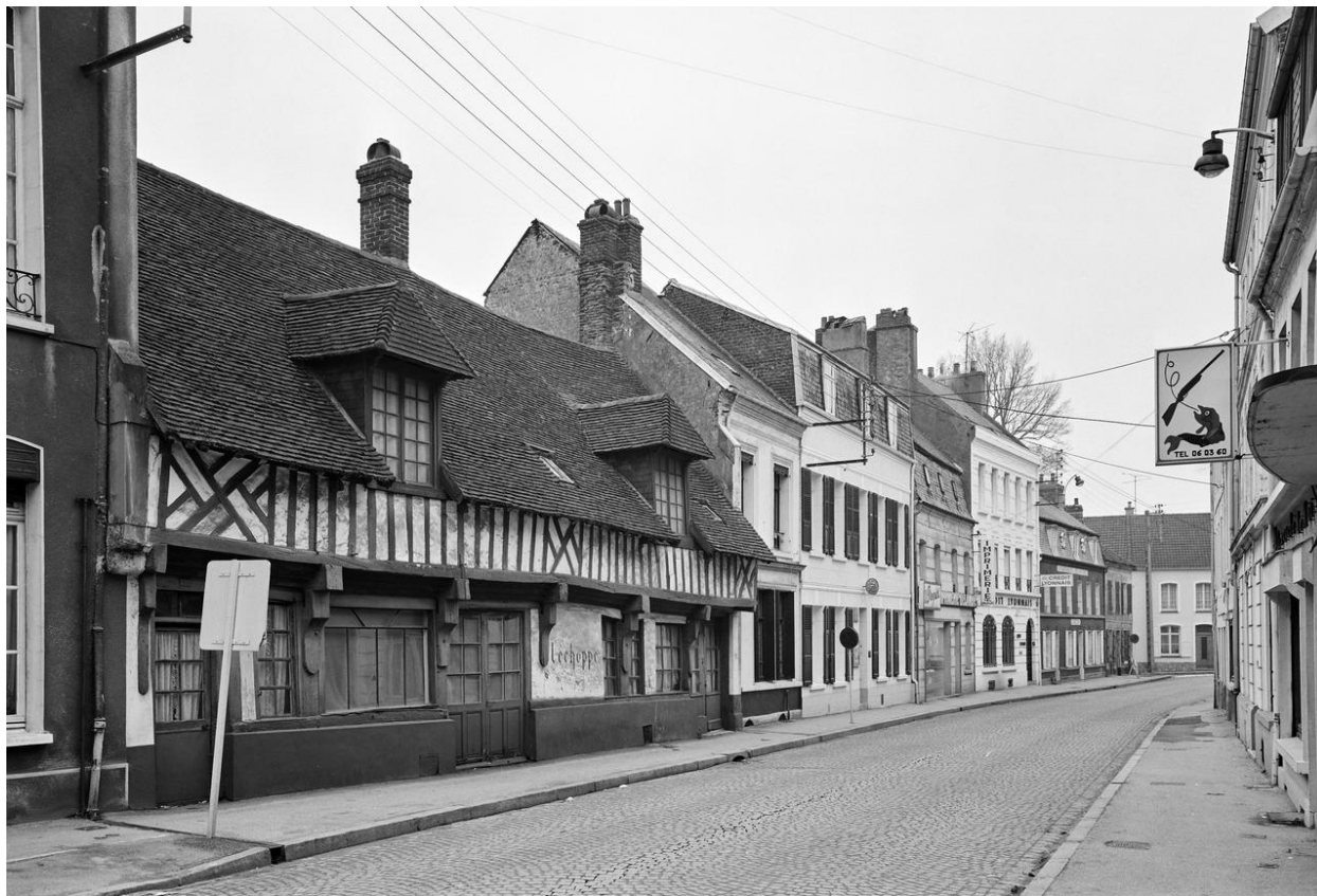
L'Âne rayé et Le Petit-Écu. Vue générale (1981).