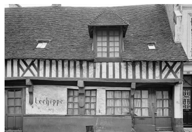
Le Petit-Écu. Façade sur rue (1981).