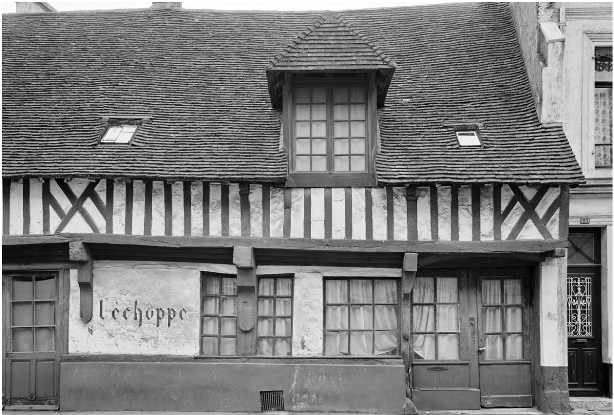
Le Petit-Écu. Façade sur rue (1981).