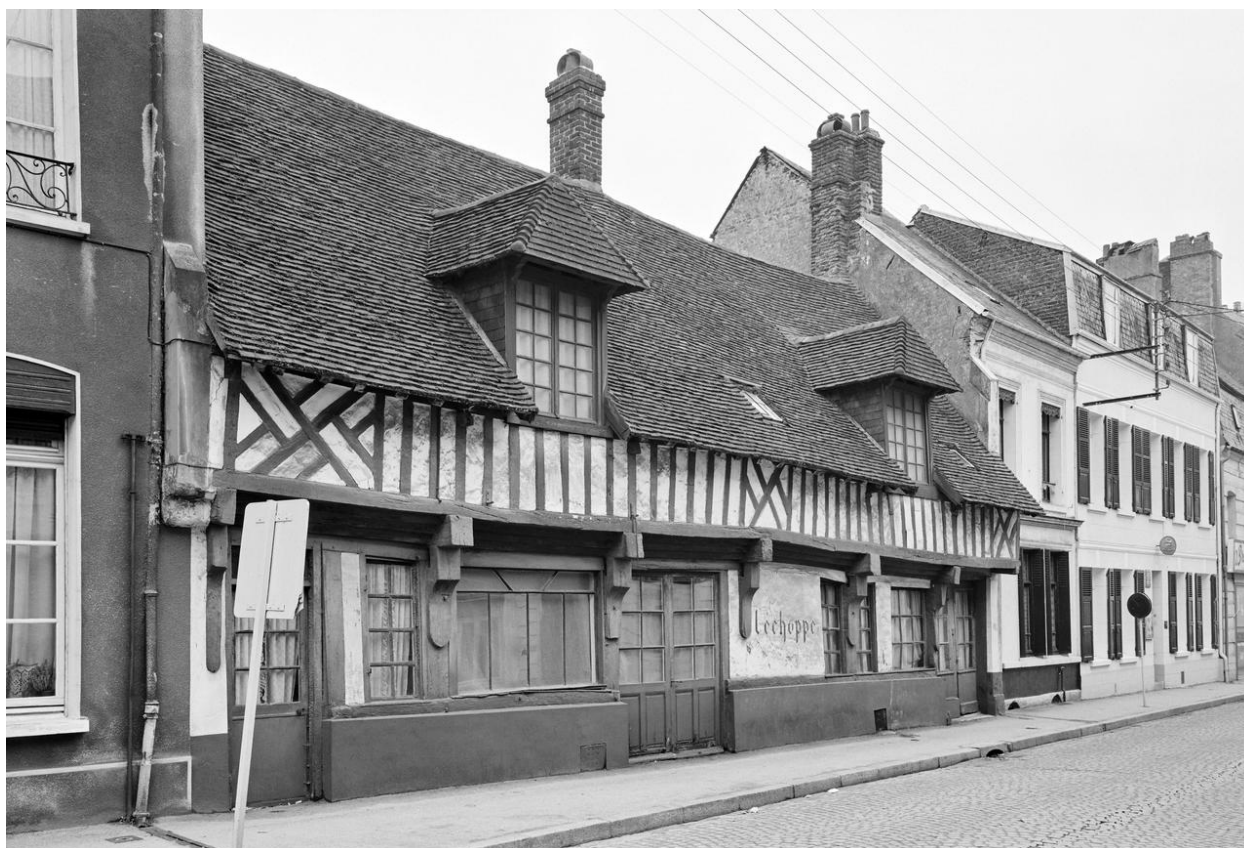
L'Âne rayé et Le Petit-Écu. Façade sur rue (1981).