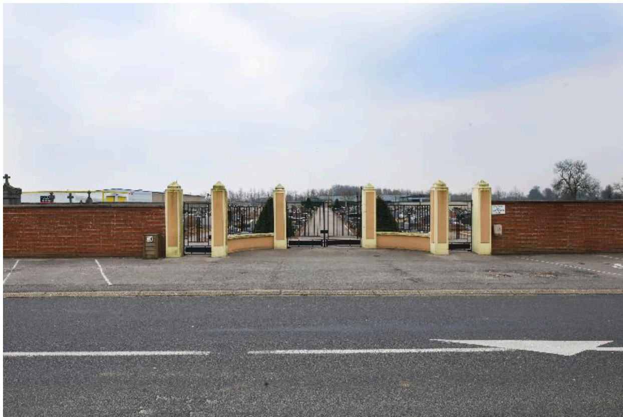
L'entrée principale depuis la rue Henri-Barbusse.