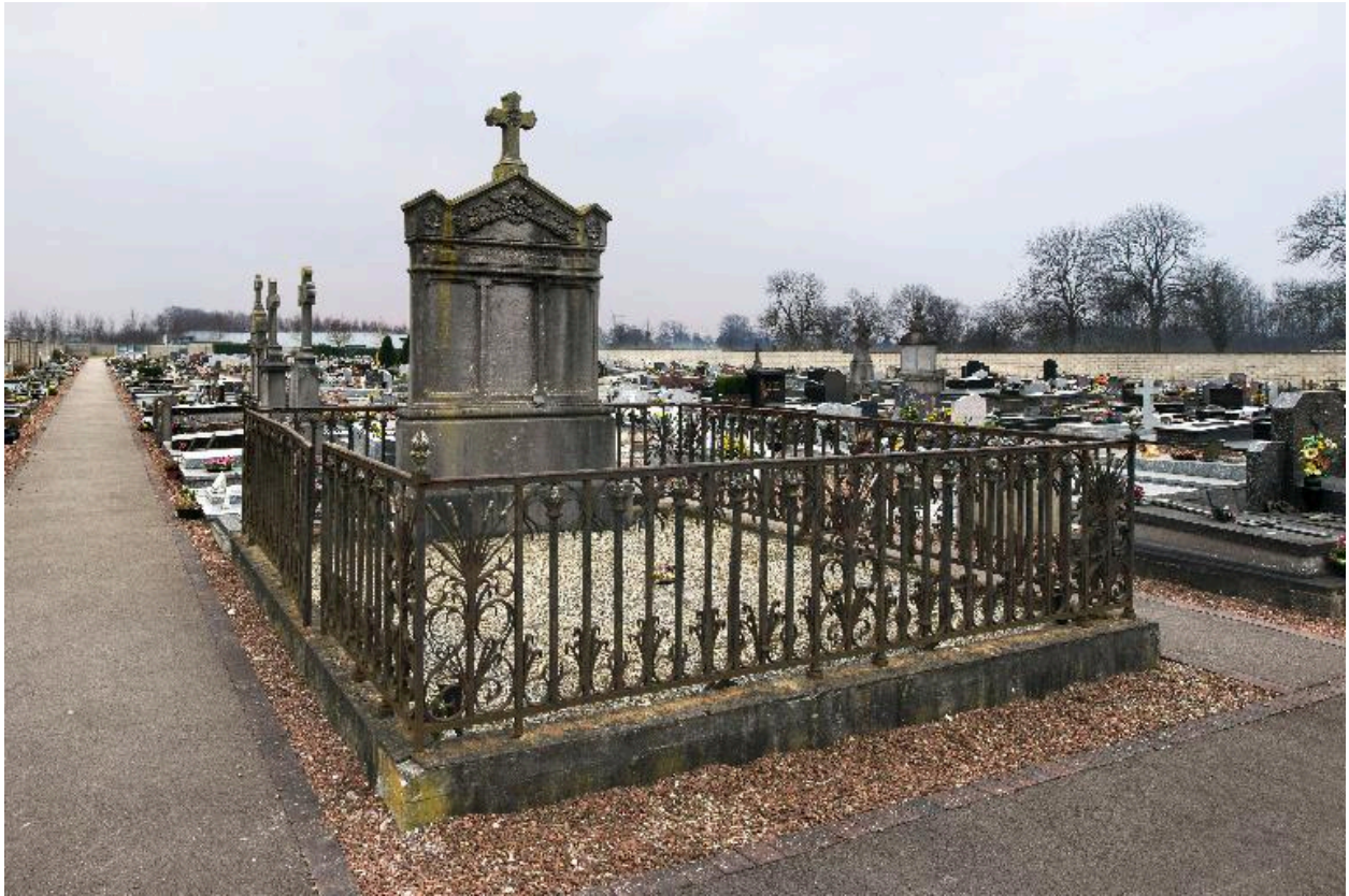
Tombeau (stèle funéraire) de la famille Guerville.