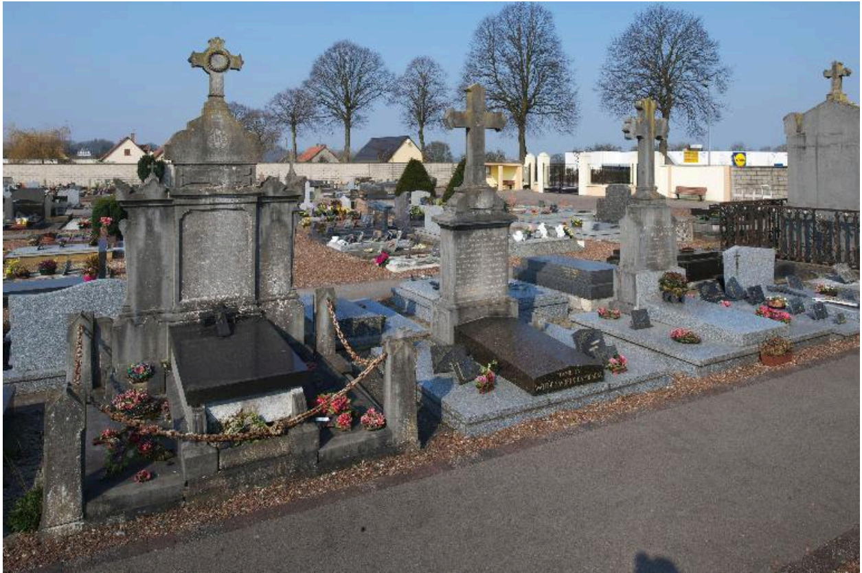
Concessions perpétuelles de l'allée latérale est. Tombeaux des familles Cazier-Wattré (à gauche), Wattré-Savreux-Damoiseau (au centre) et Sacépée-Normand-Dallery-Sacépée (à droite).