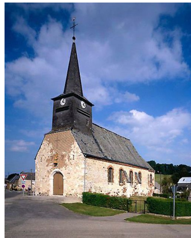
Façade occidentale, vue depuis le sud-est. IVR22_19970200969VA