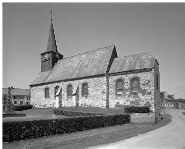
Nef et chœur depuis le sud-est.