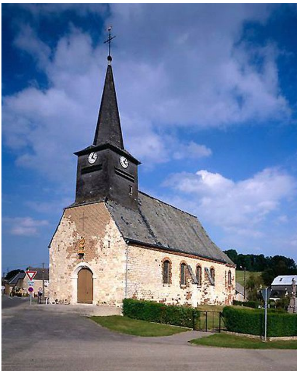
Façade occidentale, vue depuis le sud-est.