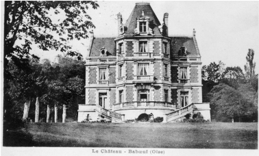
Vue générale (coll. part). IVR22_19856000314XB