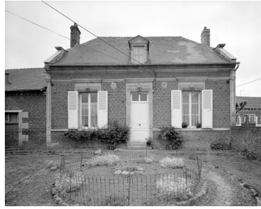
Elévation antérieure. IVR22_19856000839V

Plan de situation. Extrait du plan cadastral de 1983, section B1 64. IVR22_20096000140NUCA