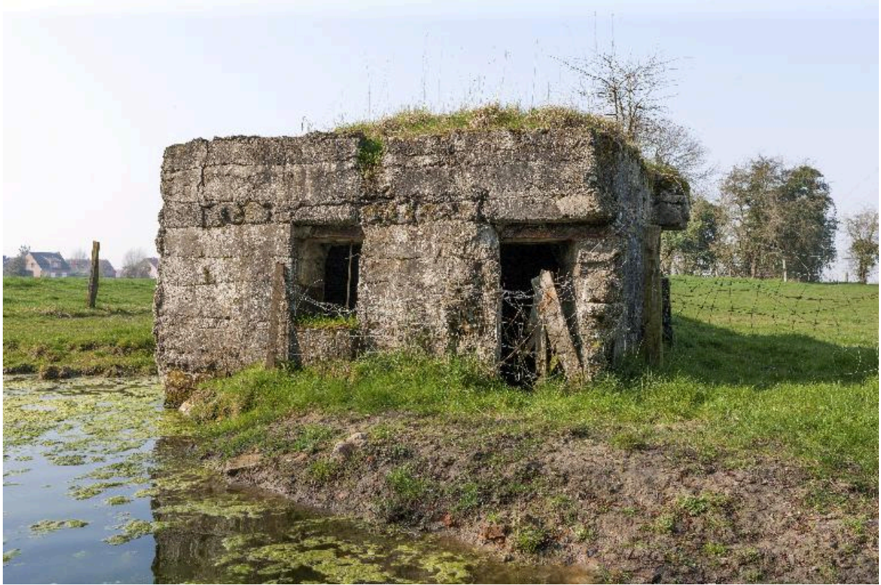
Vue de trois-quarts vers le nord-ouest