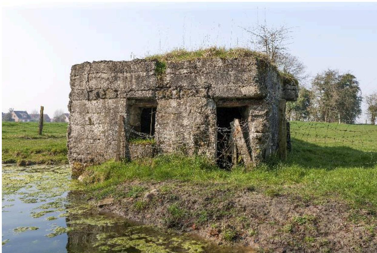
Vue de trois-quarts vers le nord-ouest