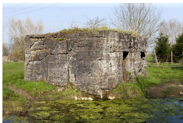
Vue de trois-quarts vers le nord-est IVR31_20145905523NUCA