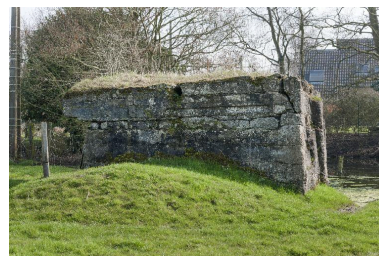
Elévation nord IVR31_20145905524NUCA