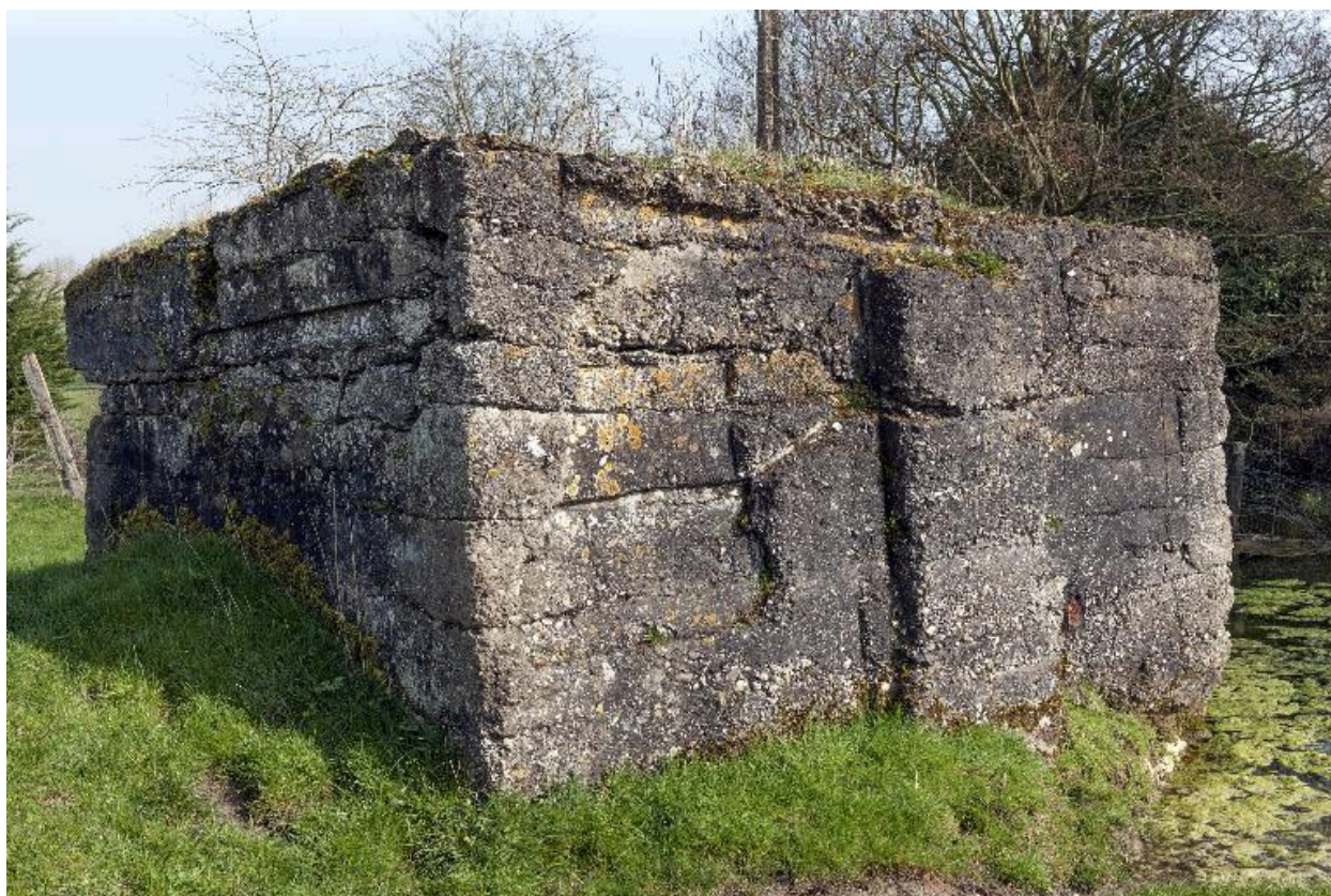
Vue de trois-quarts vers le sud-est