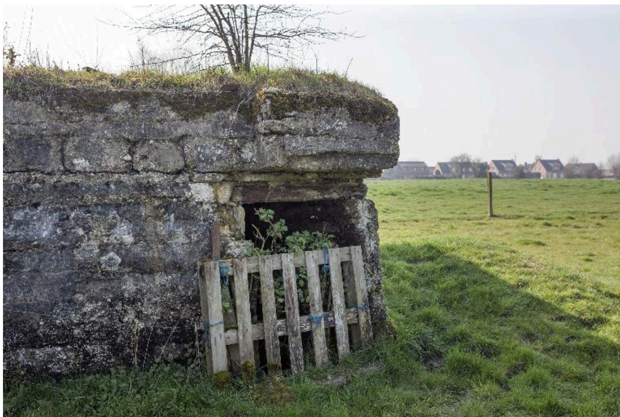
Porte sur l'angle nord-est