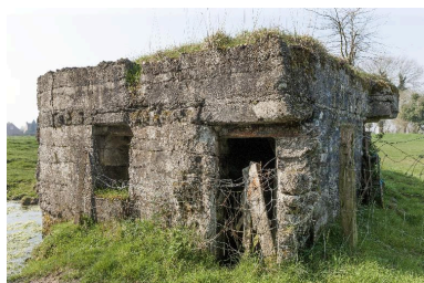
Elévatiion sud