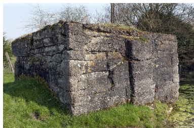
Vue de trois-quarts vers le sud-est IVR31_20145905529NUCA