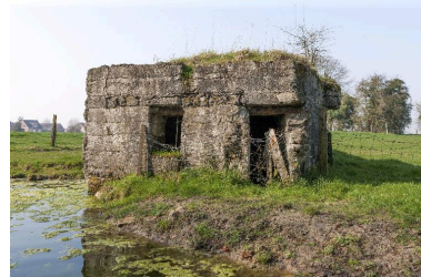
Vue de trois-quarts vers le nord-ouest