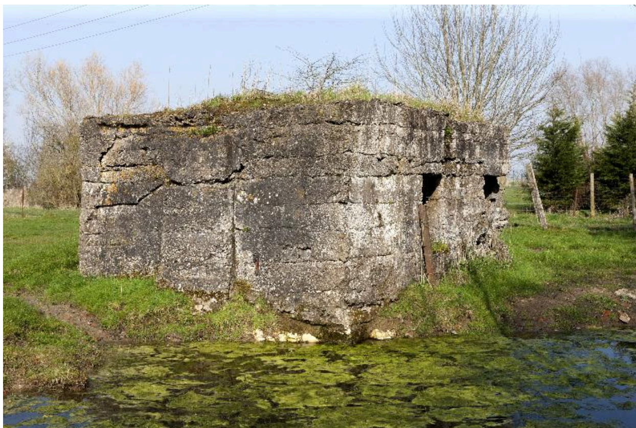
Vue de trois-quarts vers le nord-est