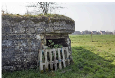
Porte sur l'angle nord-est IVR31_20145905528NUCA