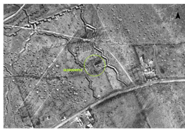
Situation de l'édifice sur une photographie aérienne britannique du 06/03/1918