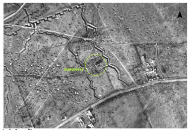
Situation de l'édifice sur une photographie aérienne britannique du 06/03/1918 IVR32_20175900921NUCA