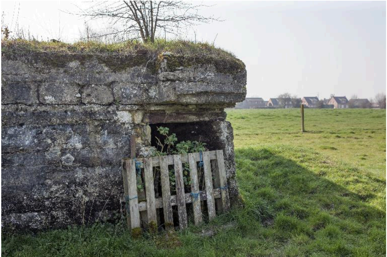
Porte sur l'angle nord-est