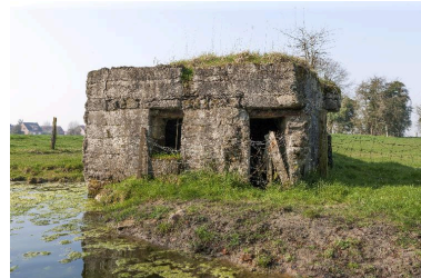
Vue de trois-quarts vers le nord-ouest IVR31_20145905526NUCA