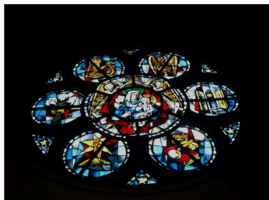
Vue générale IVR31_20126201556NUCA