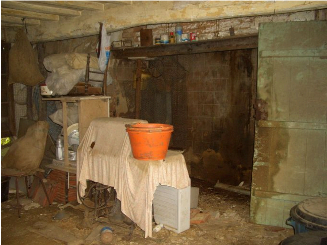
Vue de la cheminée de la salle commune.