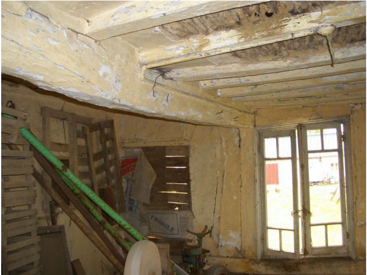
Vue intérieure de l'atelier.