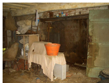
Vue de la cheminée de la salle commune. IVR22_20068005738NUCA