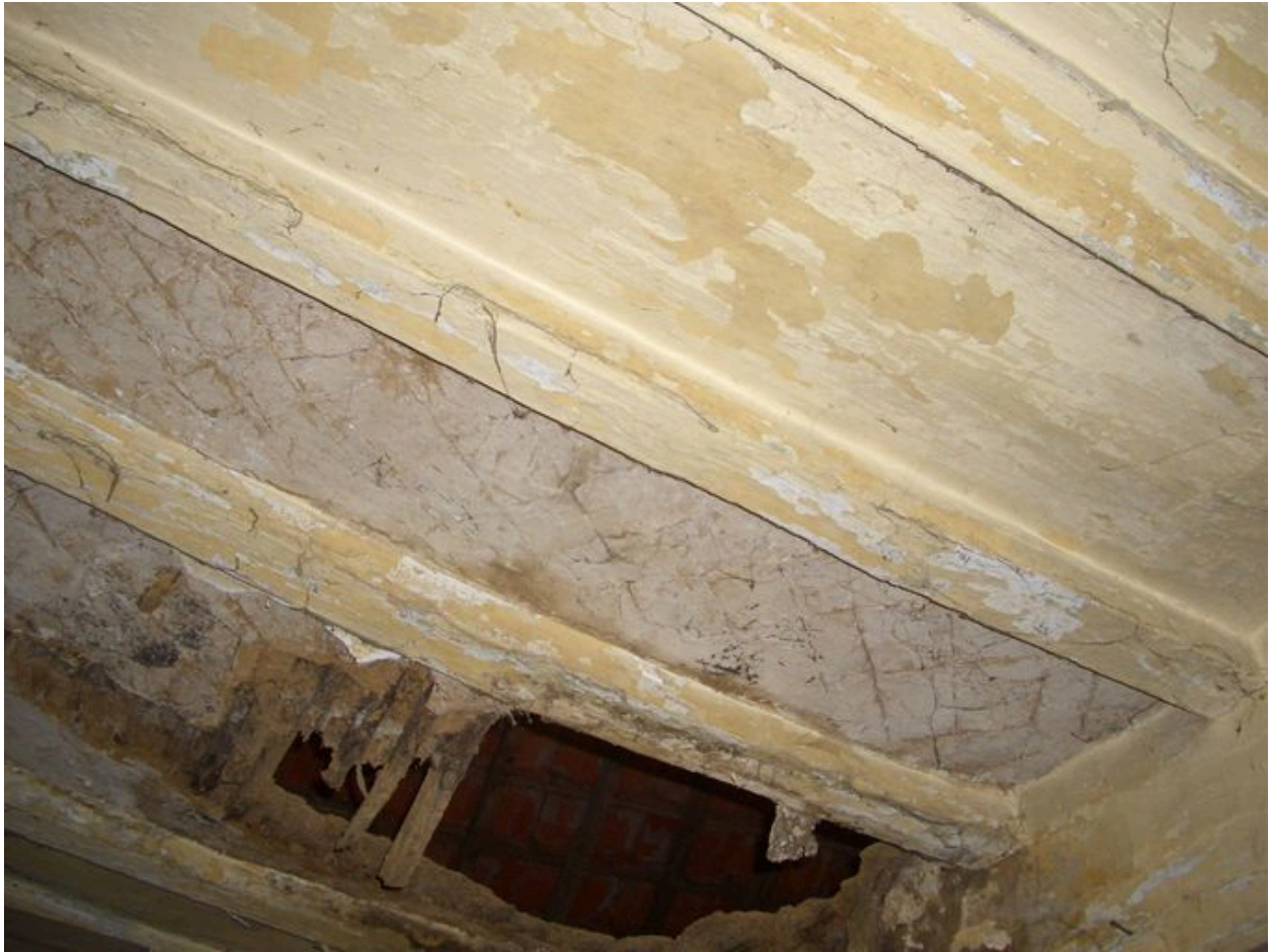
Détail du plafond de la salle commune.