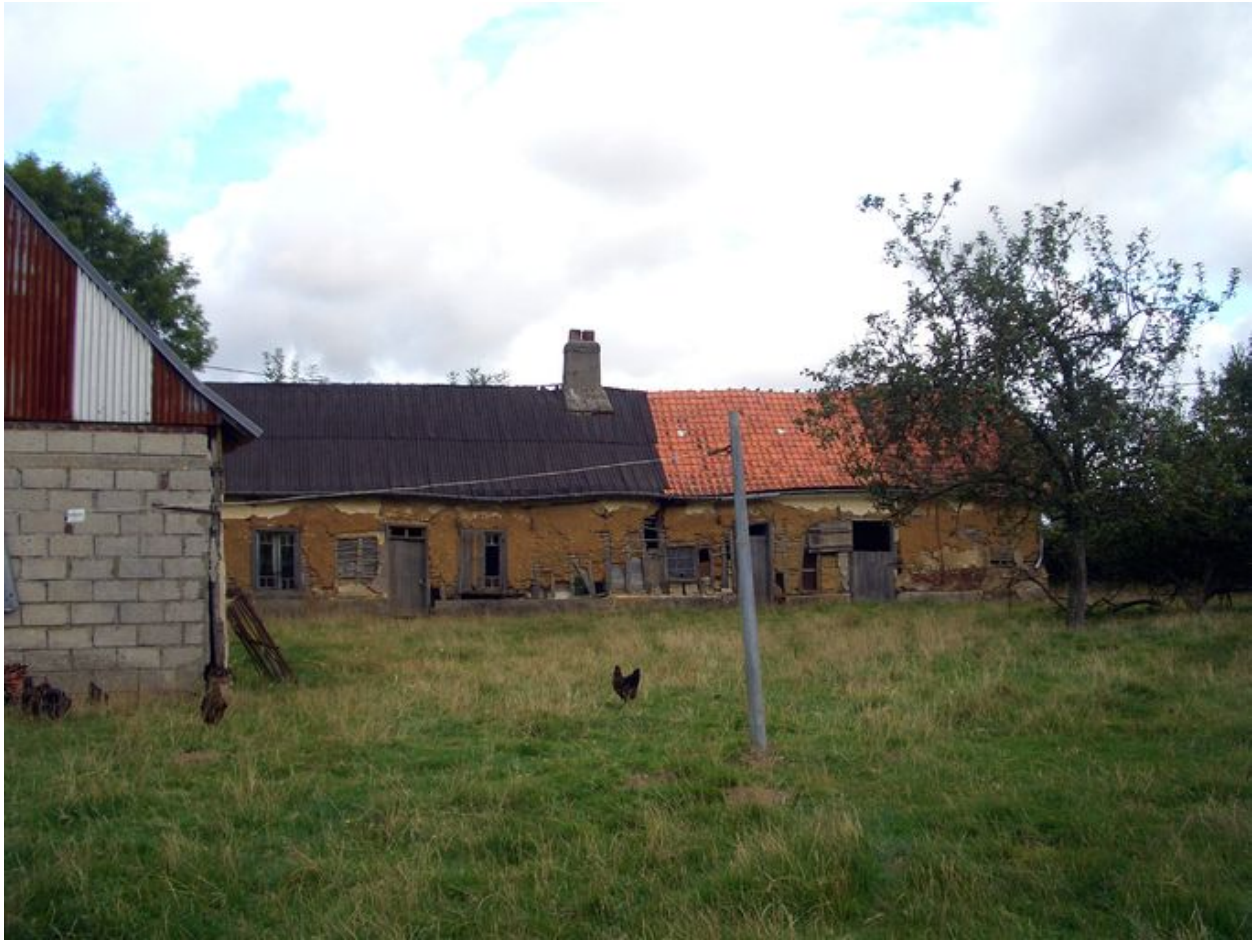
Vue de face du logis et des écuries.