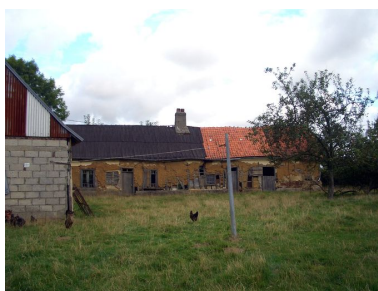
Vue de face du logis et des écuries. IVR22_20068005736NUCA