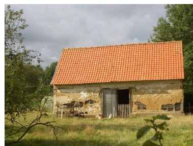
Vue de la grange. IVR22_20068005743NUCA