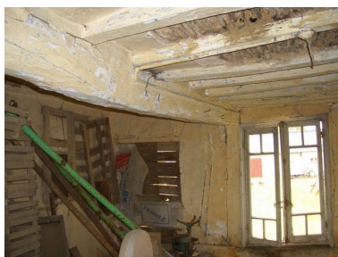
Vue intérieure de l'atelier. IVR22_20068005742NUCA