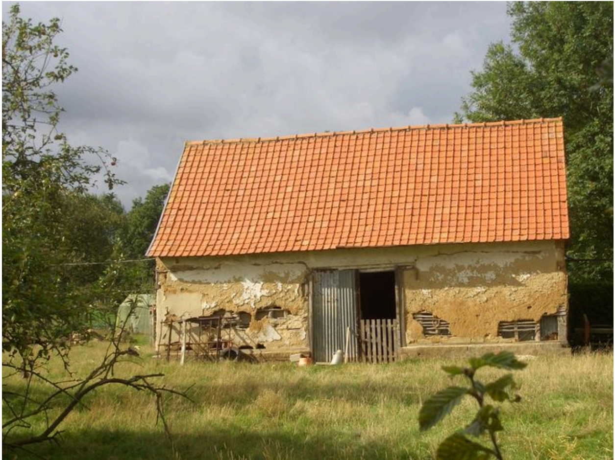
Vue de la grange.