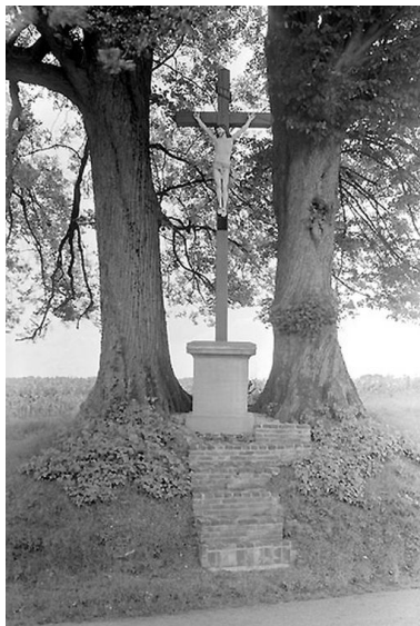
Vue générale. IVR22_19980202918X