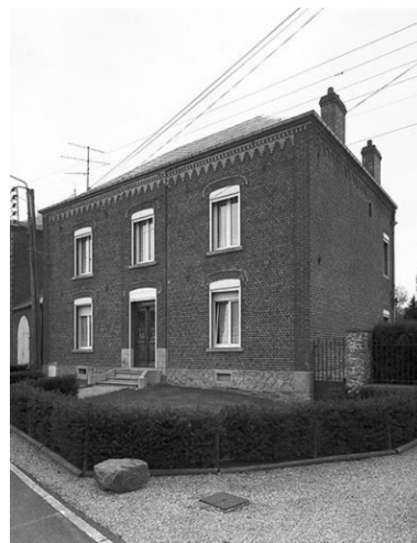
Vue générale. IVR31_20055904310V

(reproduction) IVR31_20045905234NUCA