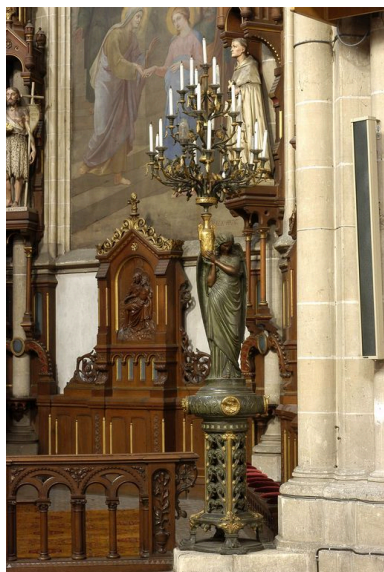
Vue générale du modèle signé. IVR22_20058001856NUCA