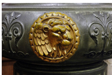
Détail d'un des médaillons (lion de saint Marc).