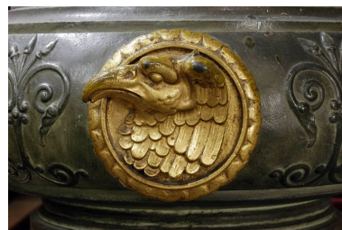
Détail d'un des médaillons (aigle de saint Jean). IVR22_20058001859NUCA