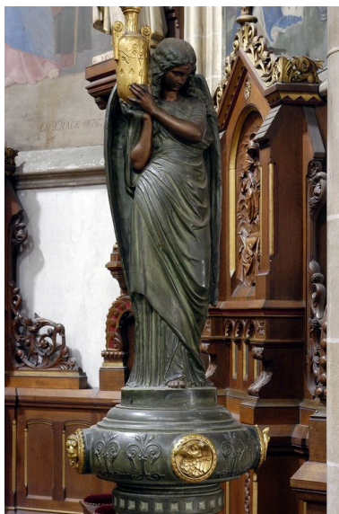
Détail de la figure. IVR22_20058001857NUCA