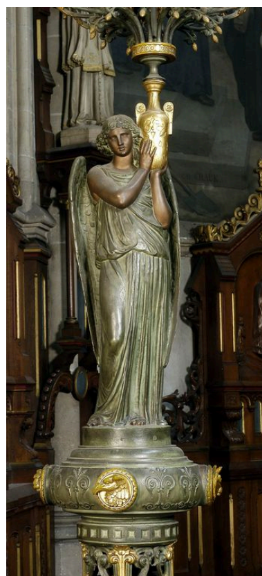
Détail de la figure du second modèle.