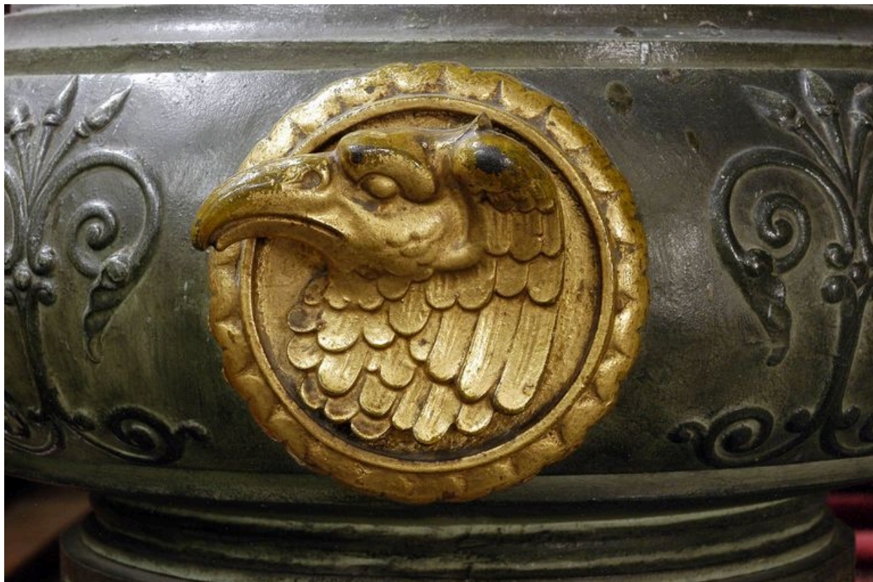
Détail d'un des médaillons (aigle de saint Jean).