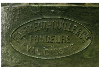
Détail de la marque de fondeur.