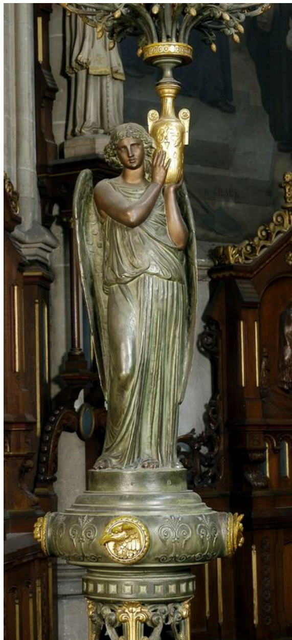
Détail de la figure du second modèle.