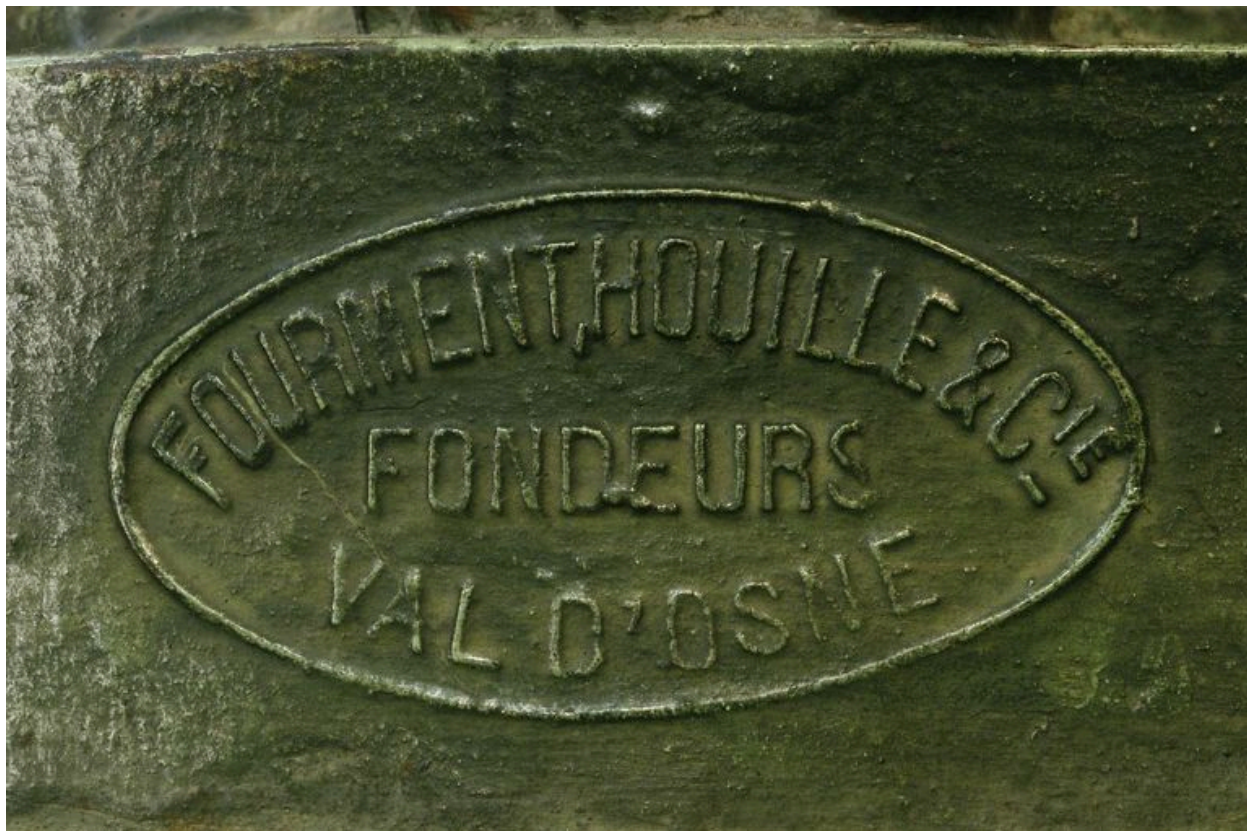
Détail de la marque de fondeur.