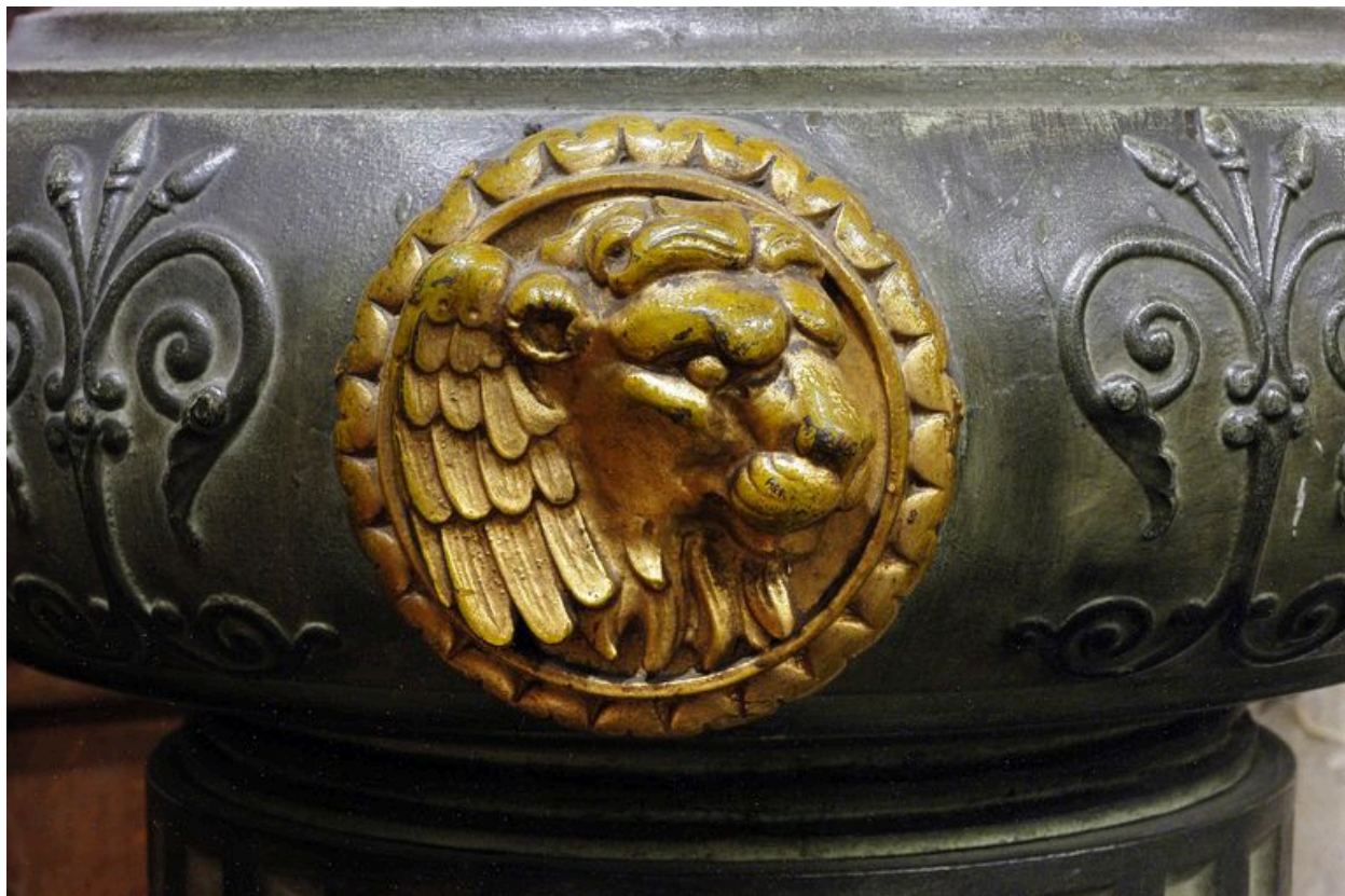
Détail d'un des médaillons (lion de saint Marc).