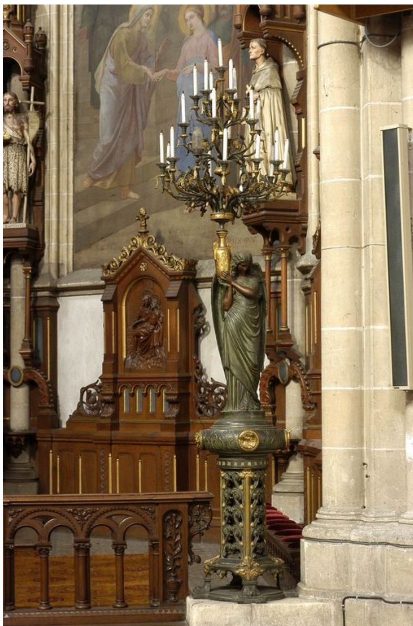
Vue générale du modèle signé.