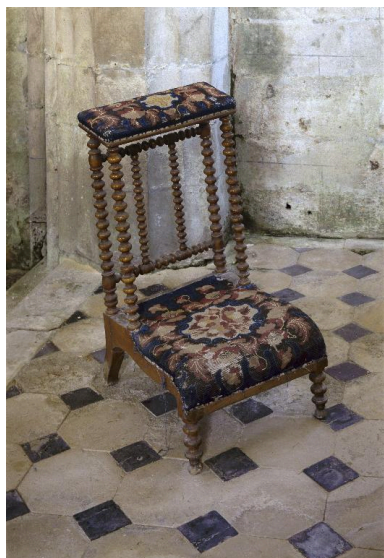
Vue générale du prie-Dieu.