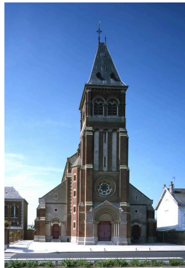
Élévation antérieure. IVR22_20048000136VA