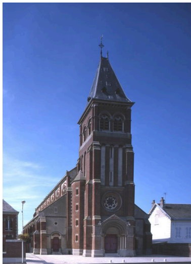
Vue d'ensemble. IVR22_20048000137VA