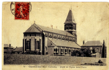
Carte postale, 1er quart 20e siècle