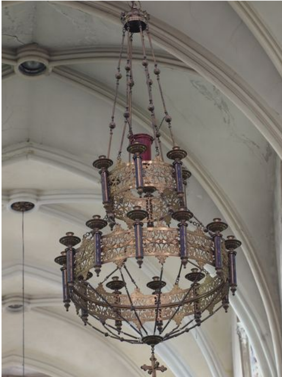
Vue générale du lustre ouest (petit)