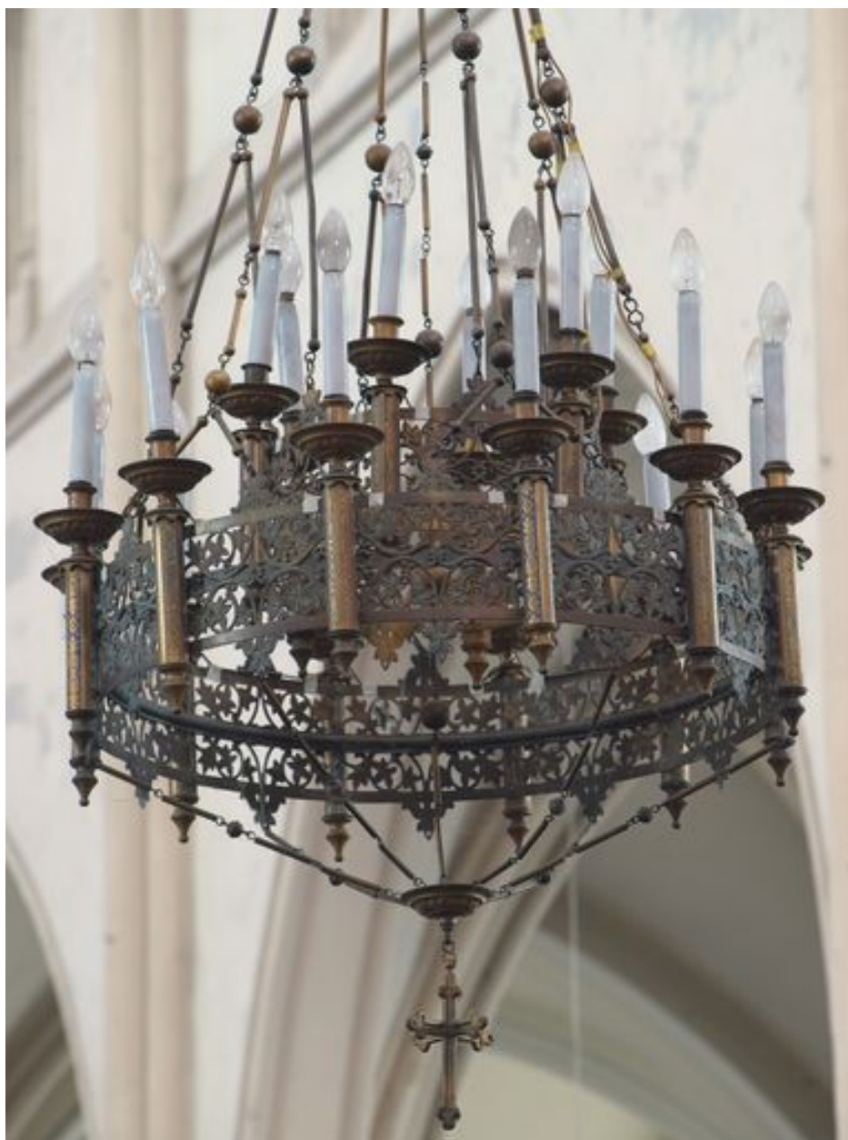
Vue rapprochée du lustre est (grand)