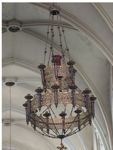
Vue générale du lustre ouest (petit)