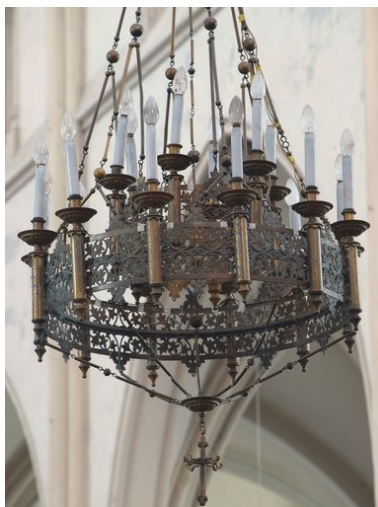
Vue rapprochée du lustre est (grand) IVR31_20106202796NUCA