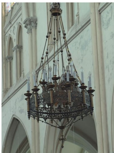
Vue générale du lustre est (grand) IVR31_20106202795NUCA