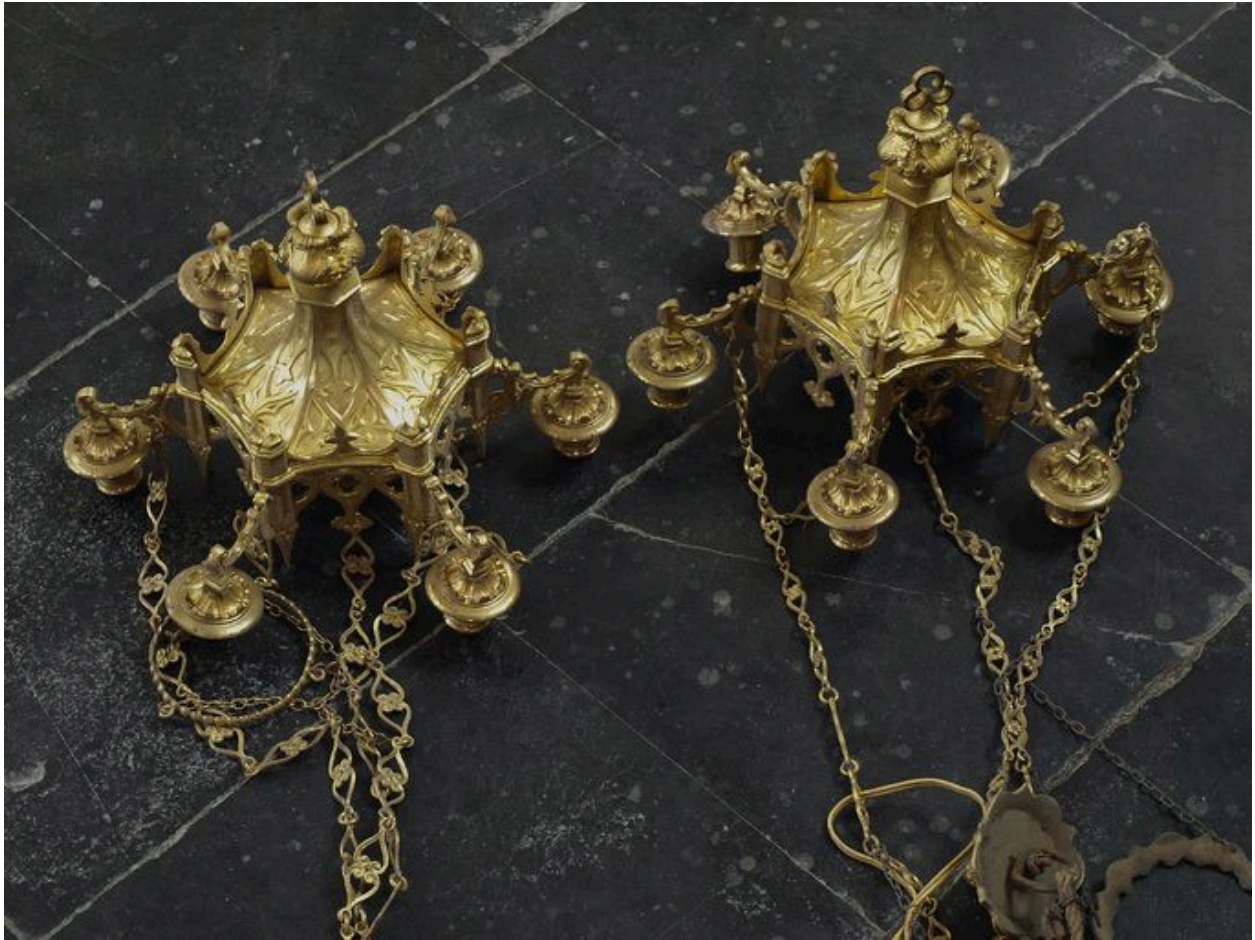
Lustres entreposés dans le banc clos sud-ouest.