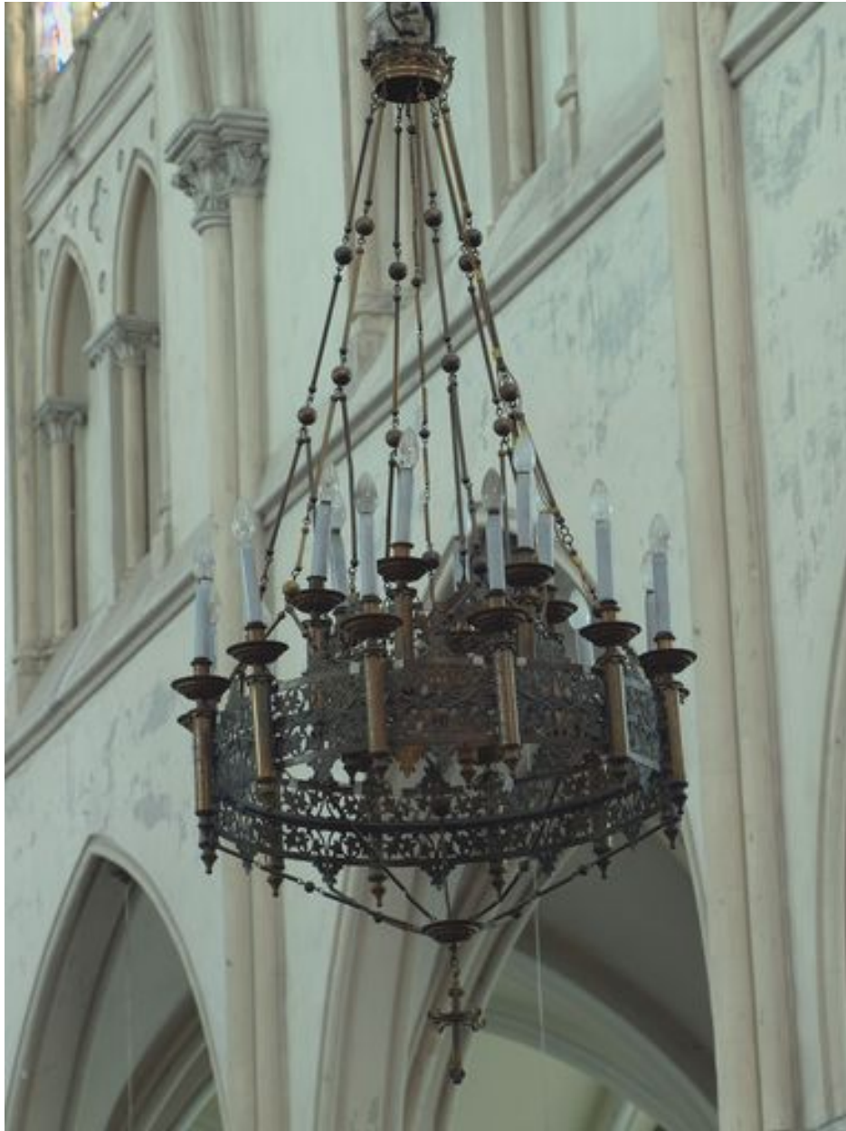
Vue générale du lustre est (grand)