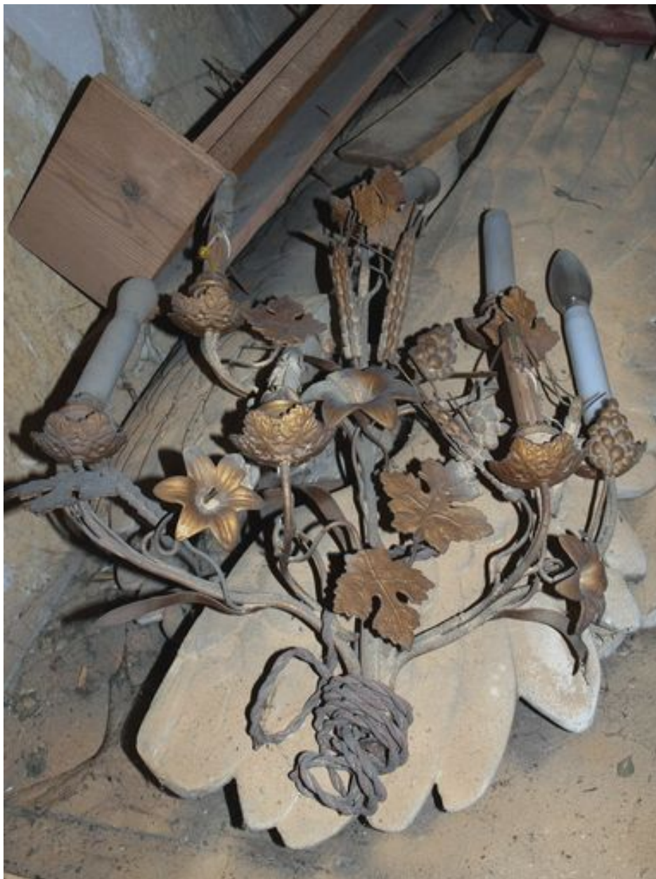
Lustre entreposé dans la sacristie.