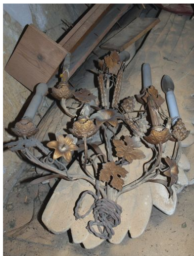
Lustre entreposé dans la sacristie. IVR31_20106202883NUCA