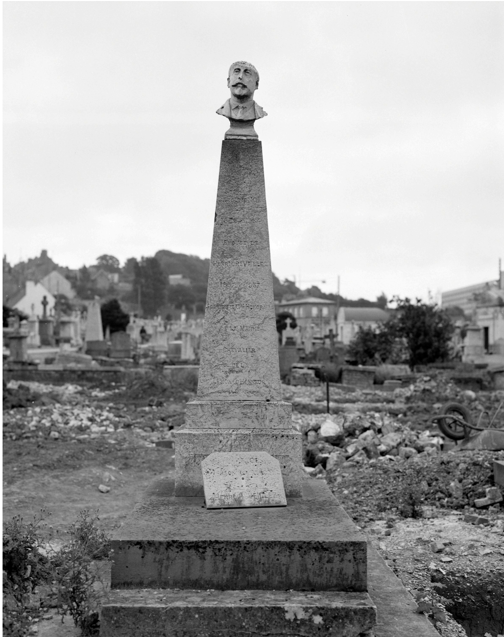
Vue générale en 1981.