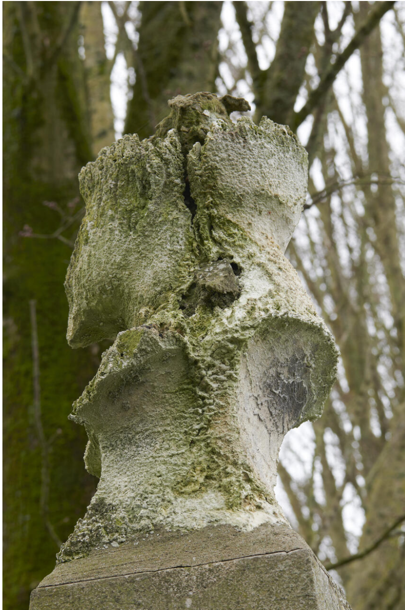
Détail du buste très endommagé en 2024.