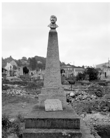
Vue générale en 1981. IVR31_19816203286X