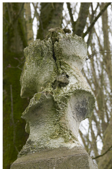
Détail du buste très endommagé en 2024. IVR32_20246200068NUCA