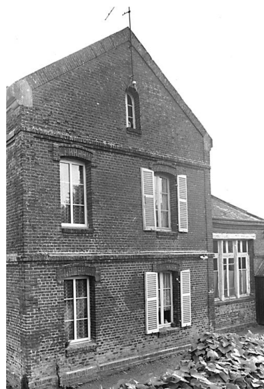
Elévation postérieure. IVR22_19980201232Z