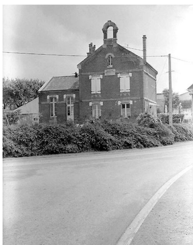
Elévation antérieure. IVR22_19980200999X