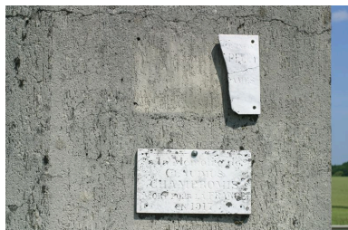
Détail de deux plaques commémoratives.