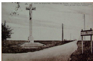
Vue ancienne (coll. part). IVR22_20030202649NUCAB