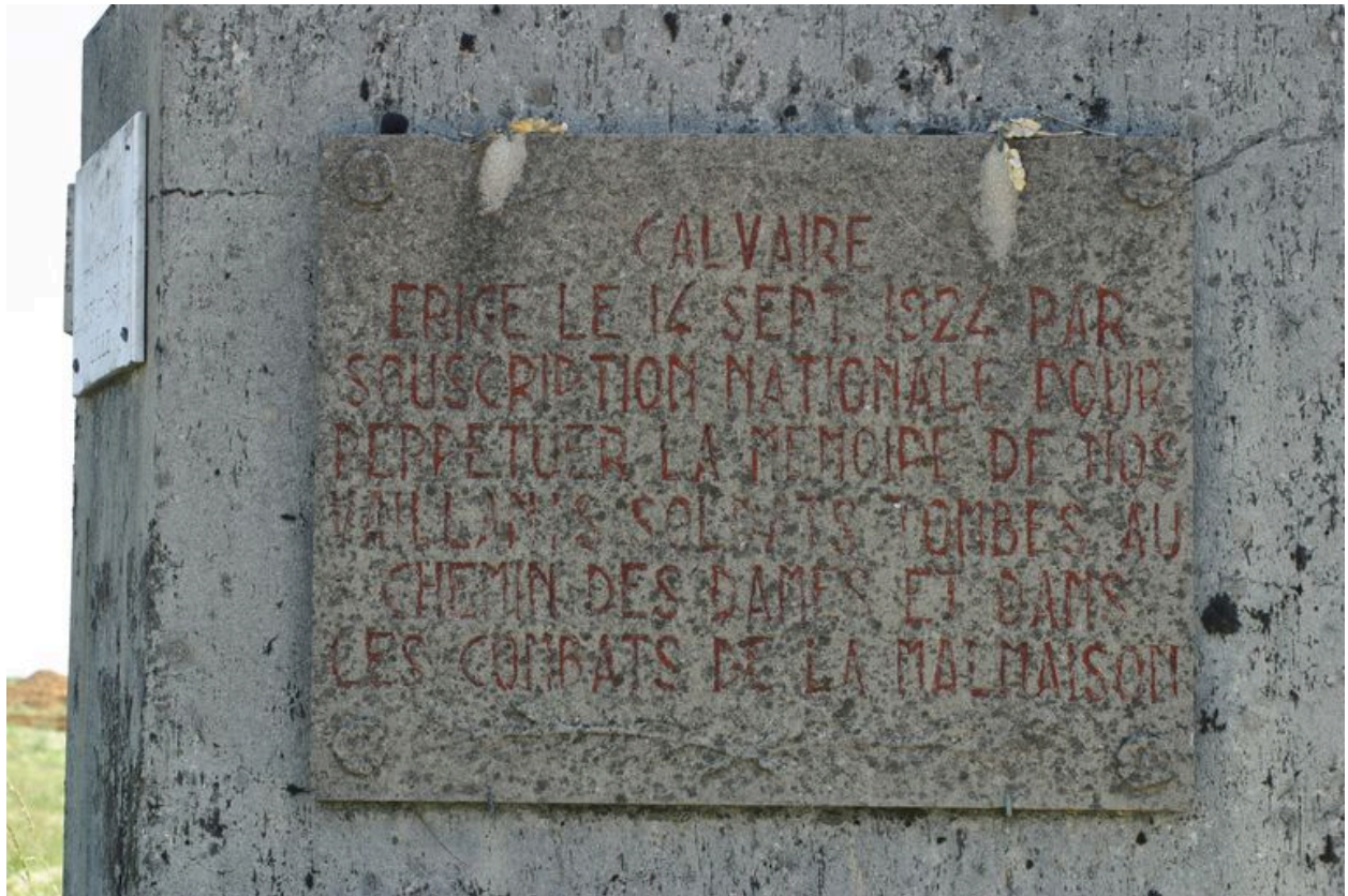
Vue d'une plaque commémorative.