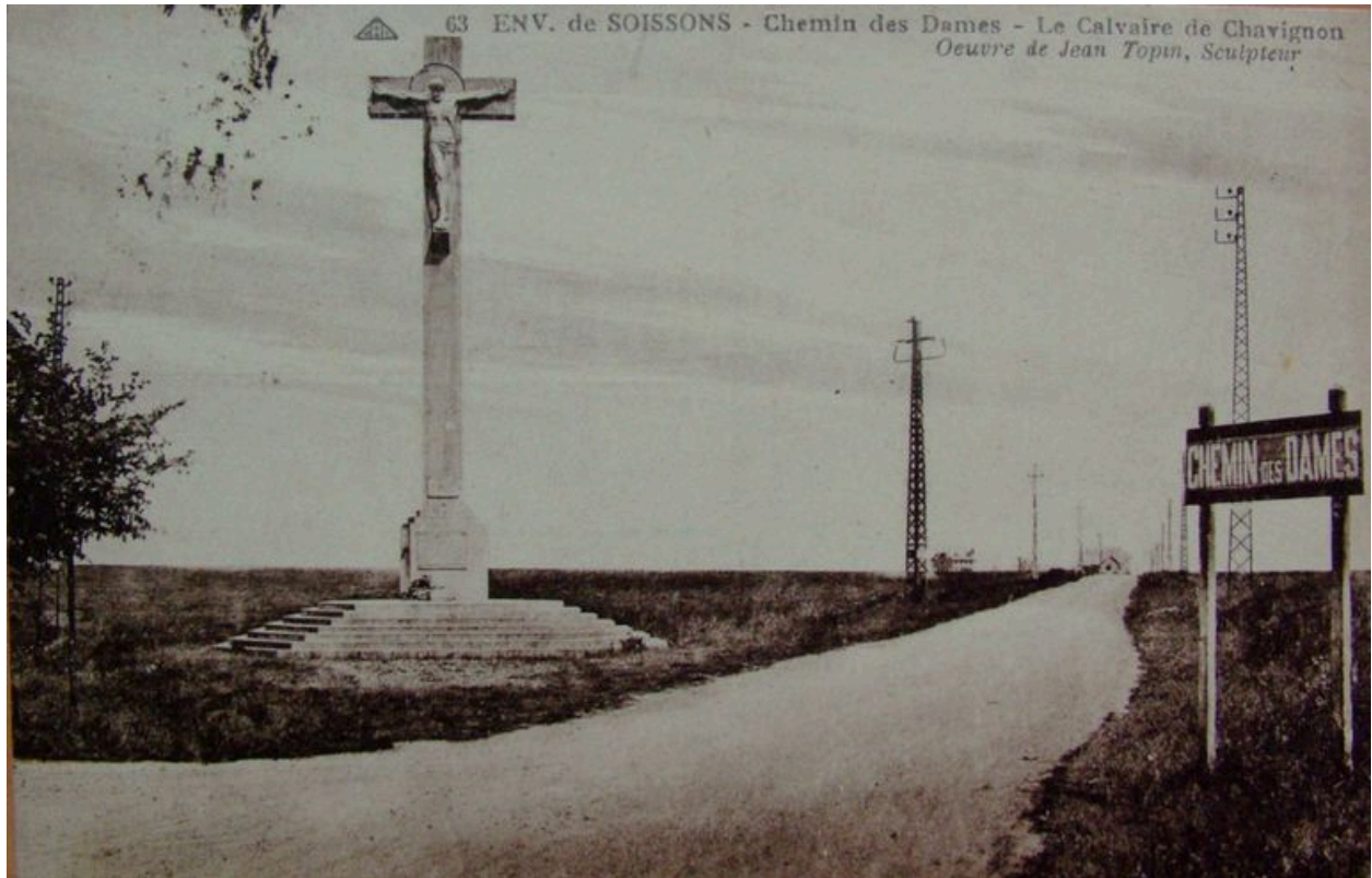
Vue ancienne (coll. part).