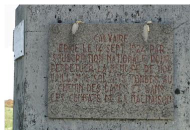
Vue d'une plaque commémorative. IVR22_20030202215NUCA