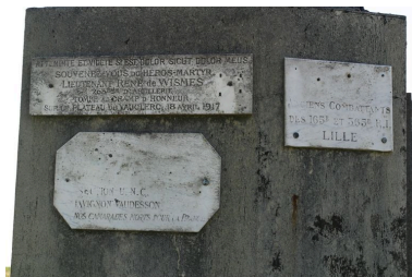
Détail de plaques commémoratives.