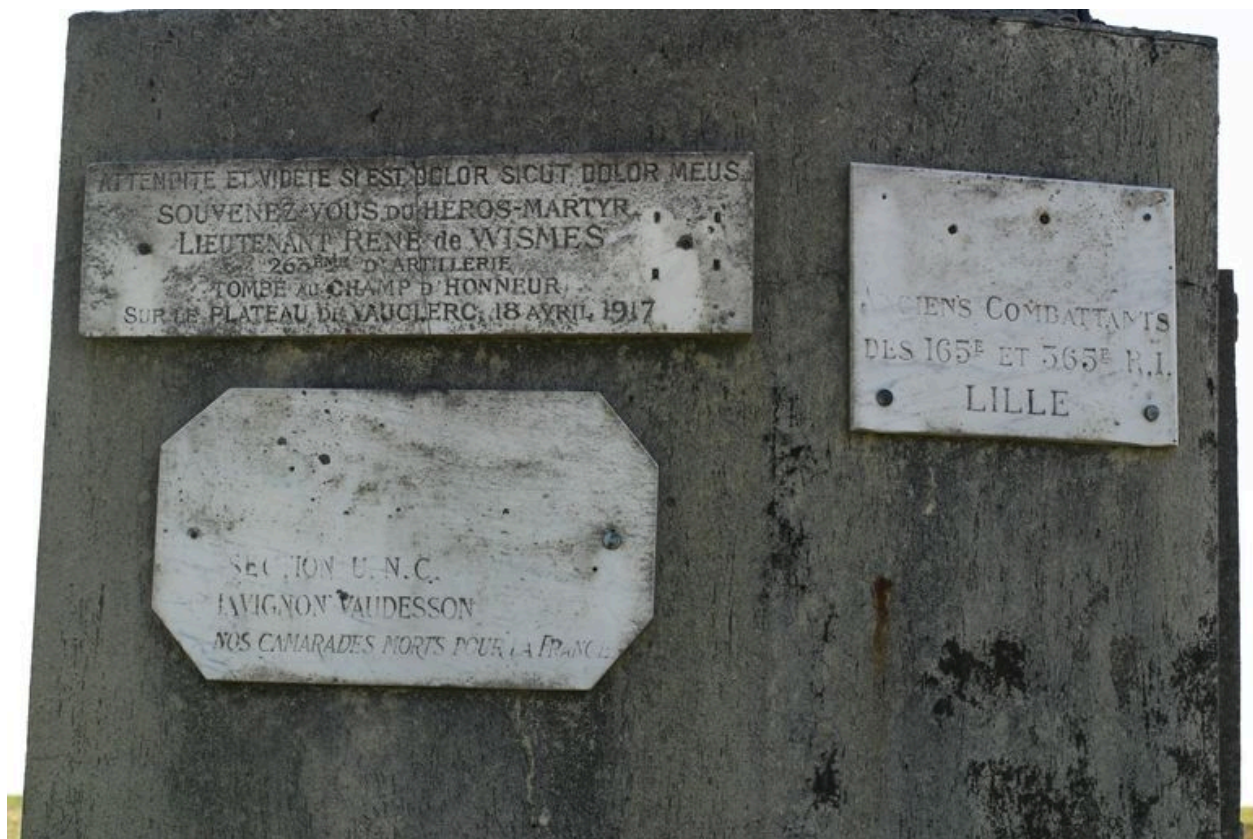
Détail de plaques commémoratives.