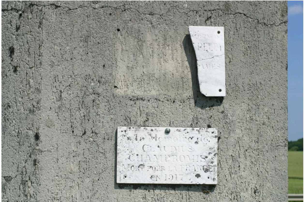
Détail de deux plaques commémoratives.