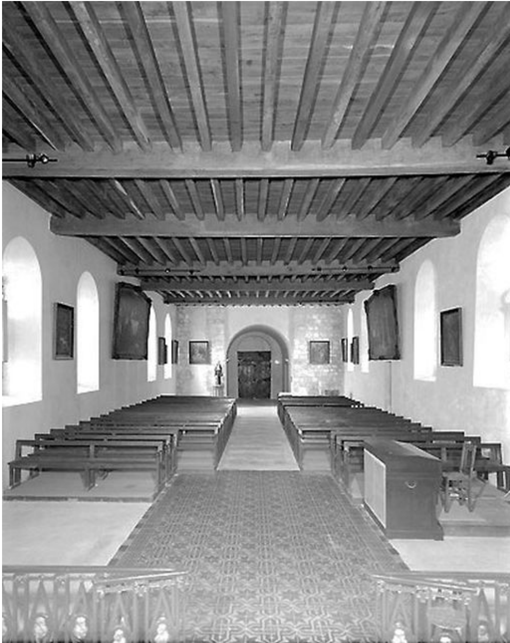
Vue intérieure du choeur vers la nef.