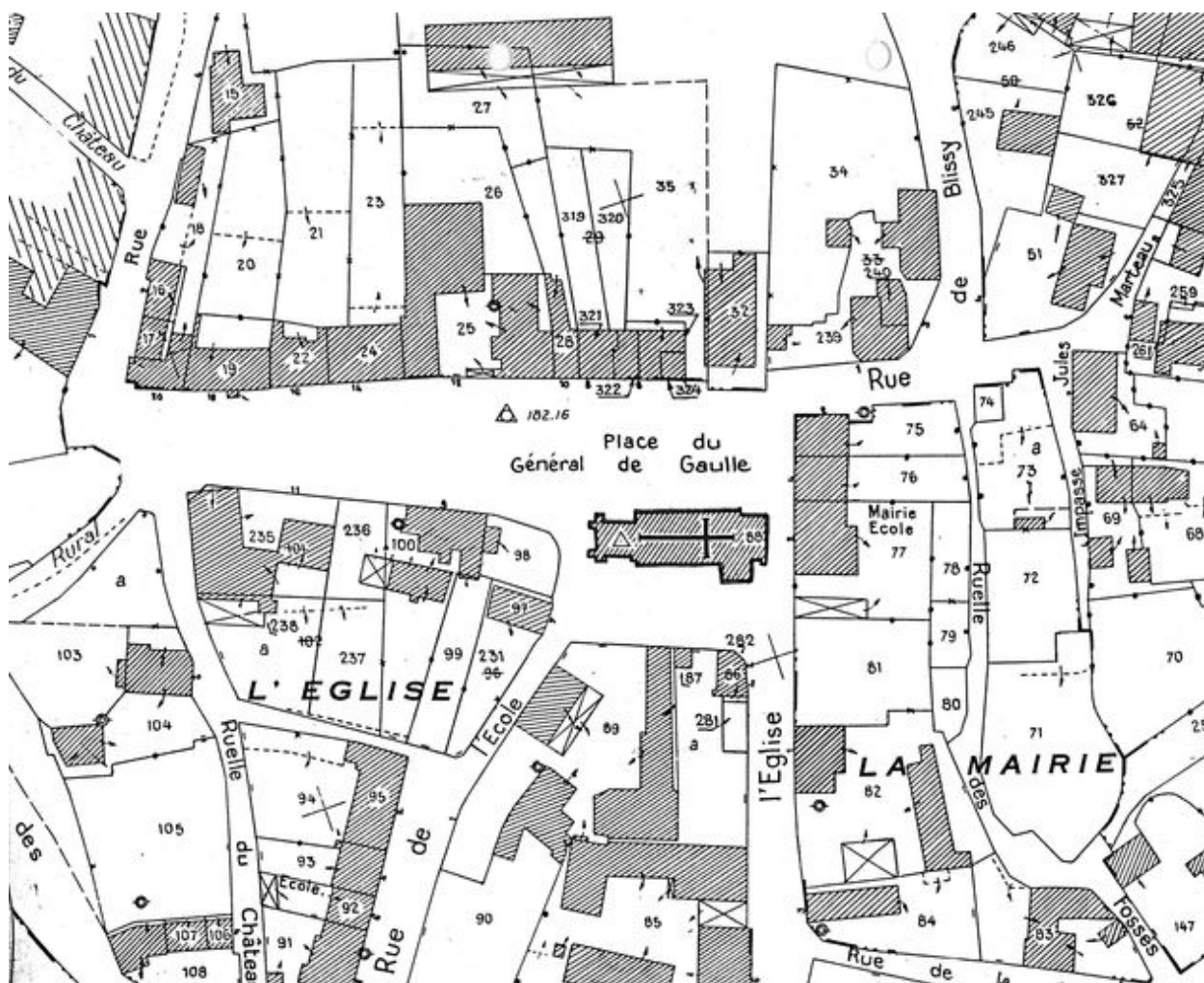
Plan de situation. Extrait du plan cadastral de 1986, section A.