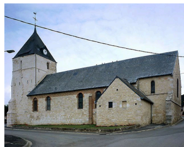
Elévation sud.