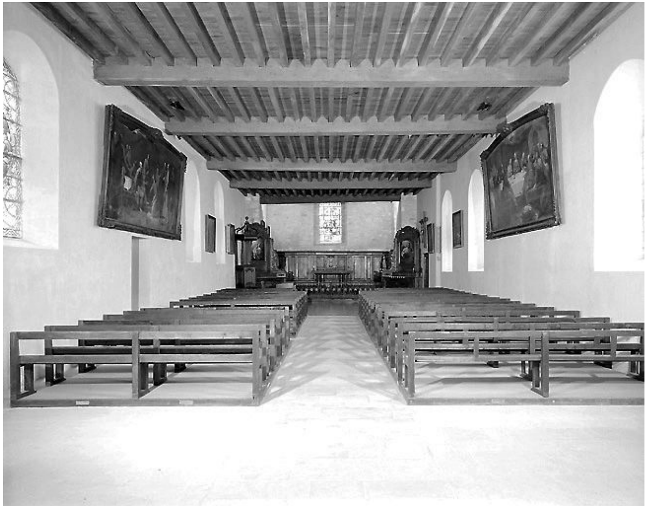
Vue intérieure de la nef vers le chœur.