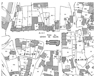
Plan de situation. Extrait du plan cadastral de 1986, section A. IVR22_20080290148NUCA