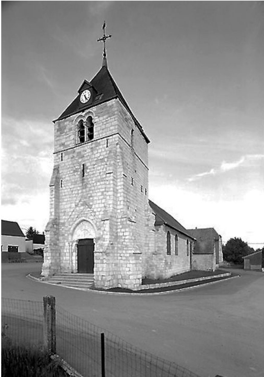
Vue depuis le sud-ouest.