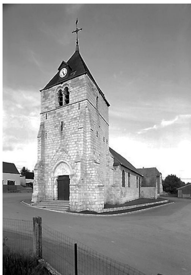
Vue depuis le sud-ouest. IVR22_20010201716P