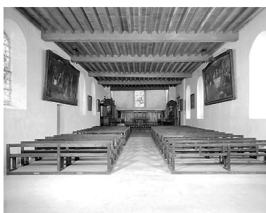
Vue intérieure de la nef vers le chœur.