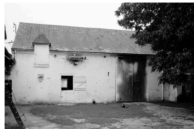
Etable et grange en fond de cour. Elévation antérieure.