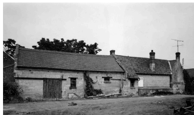
Second logis, four et étables. Elévation postérieure. IVR22_19846001104X