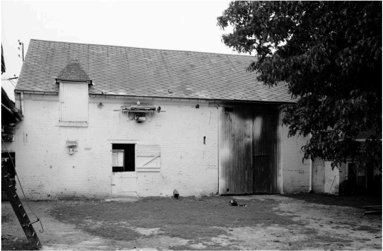
Etable et grange en fond de cour. Elévation antérieure.