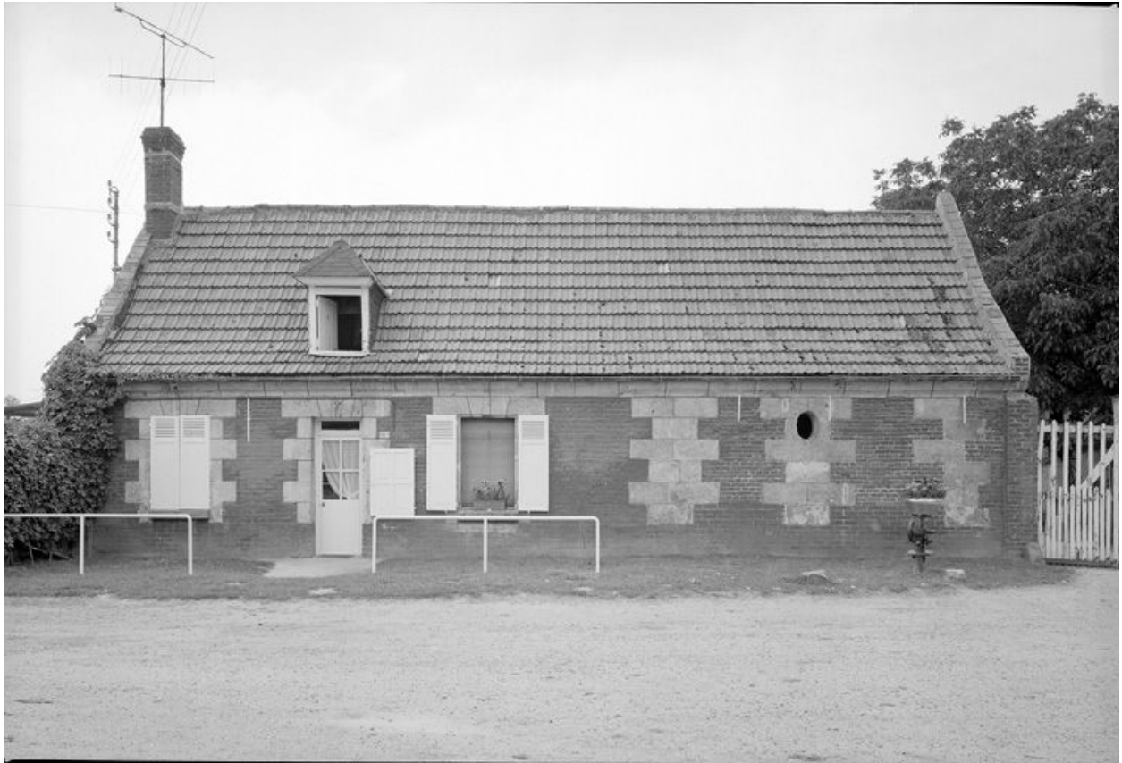
Logis sur rue. Elévation antérieure.