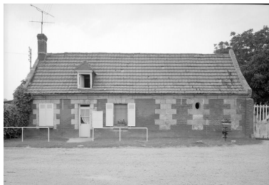
Logis sur rue. Elévation antérieure. IVR22_19846001103X