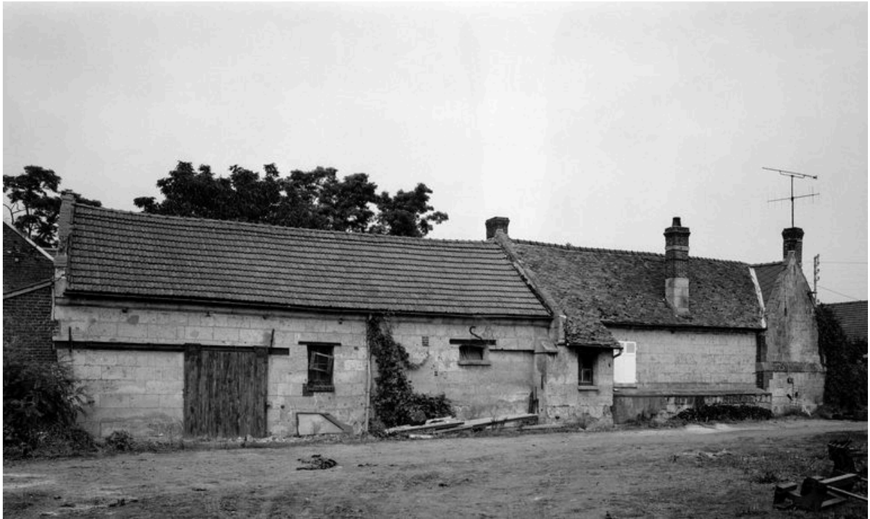
Second logis, four et étables. Elévation postérieure.