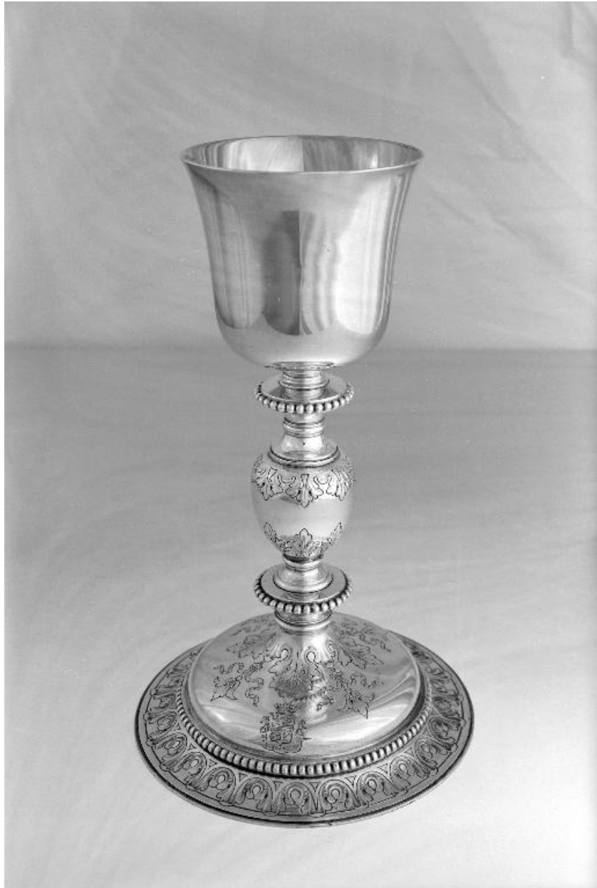
Vue de la face avec les armoiries sur le pied.