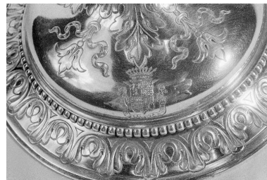
Détail des armoiries sur le pied.