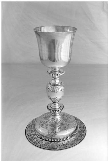
Vue de la face avec les armoiries sur le pied.