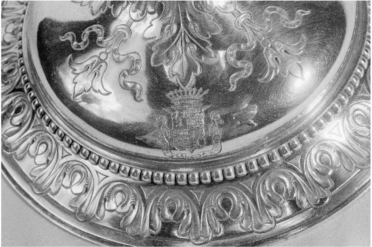
Détail des armoiries sur le pied.