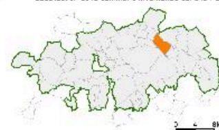
Carte de datation des édifices repérés.

Localisation de la commune Bruille-Saint-Amand dans le Parc