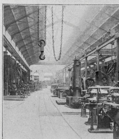
Hall de montage des machines-outils.

Occupés par les Allemands dès les premières semaines de septembre, ces Etablissements ne furent abandonnés par eux qu'au début de novembre 1918. Durant ces longues années, les occupants s'adonnèrent à leurs instincts de vandales, et les divers ateliers furent vidés de leur matériel et de leur outillage. Des charpentes furent démontées, des fondations nivelées et de ce fait, certains ateliers avaient complètement disparu.