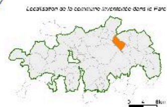
Carte des maisons repérées.

IVR31_20155905005NUCA Date de prise de vue : 2015