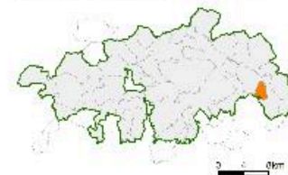
Carte des fermes repérées.

Localisation de la commune inventoriée dans le Parc